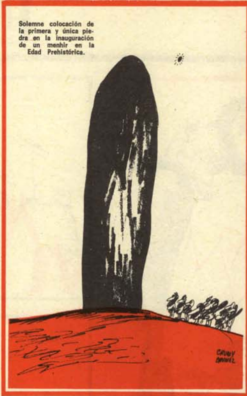
Solemne colocación de la primera y única piedra en la inauguración de un menhir en la Edad Prehistórica.