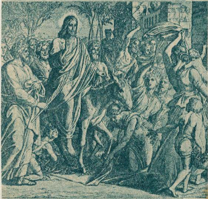
"Entrada en Jerusalén", por G. Claudet.