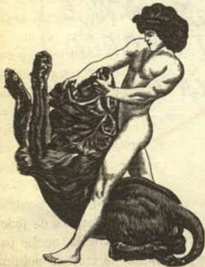
Economista joven venciendo teóricamente a la inflación.