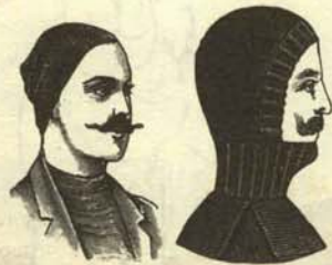
Pasamontañas de lana para cruzar sin peligro el año 1975.