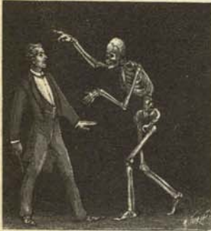
Fantasma de la inflación discutiendo con un economista académico.