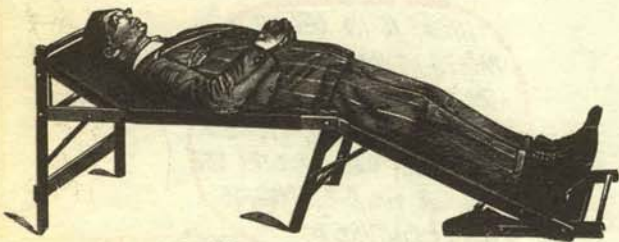
Estraperlista de los cuarenta viéndolas venir a ver que cae.