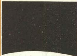
1. En el mundo está el futuro un poquito más que oscuro.