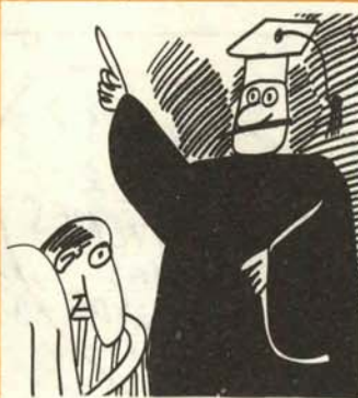
11. De quiebras y suspensiones están llenas las sesiones.