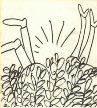
10. Como burros excitados están los enamorados.