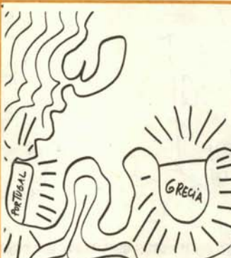
5. Se extienden las democracias ¡Y esc tiene poca gracia!