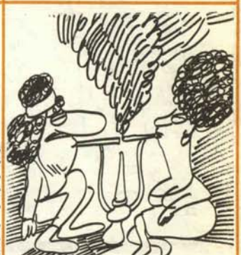
6. Se consume marihuana de la noche a la mañana.