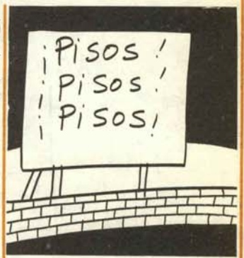
3. Ganan el tresmil por cien y fingen hacer el bien.