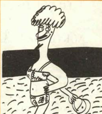
8. Las perversiones sexuales son ya costumbres normales.