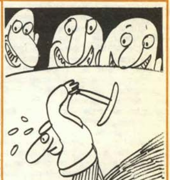
9. El buen sudor de tu frente hace reír a la gente.