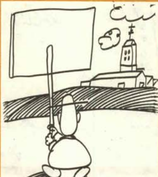
4. Anda muy revuelto el clero y no sobra el misionero.