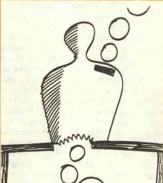
7. Se va el dinero a la porra a quien lo guarda y ahorra.