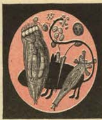
Glóbulo rojo con ratón.