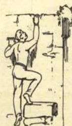
Trepamiento a través de la oposición dentro del orden.

Para trepar en política, hay muchos sistemas, de los que destacamos los siguientes: