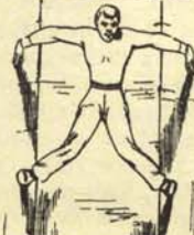
Trepamiento dentro del sistema.