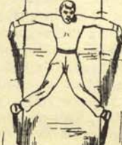
Trepamiento dentro del sistema.