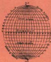
Fig. 83. - Situación del globo.