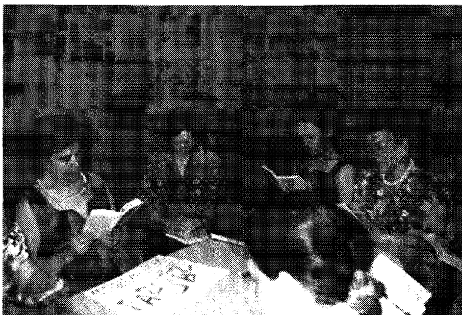
Taller de animación a la lectura para mujeres en la Biblioteca de Hortaleza.

DIFUSIÓN. La difusión de esta actividad se hace mediante carteles, folletos de mano y de viva voz a través de las bibliotecas, centros culturales y comerciales, asociaciones de vecinos, de mujeres (que en algunas ocasiones han solicitado la realización de algún taller en su zona), Centros de Animación Socio-Cultural de Madrid, Centros de Educación de Adultos, radio y prensa. Y además, la publicidad que hacen las