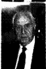
Pedro Lain Entralgo

Banco Central Hispanoamericano, Banco Herrero, Banco Zaragozano, Bilbao Bizkaia Kutxa, Caja de Madrid, Cartera Zaragozano, Grupo Eulen, Iberduero, Metrópolis, Petronor, Técnicas Reunidas y Unión Eléctrica Fenosa.