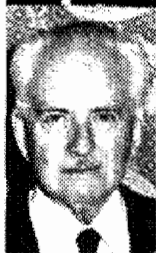
Julio Caro Baroja