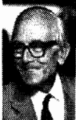
José María Jover Zamora