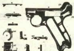
b. Nueva organización de las piezas.