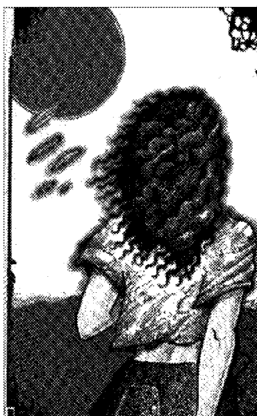
PENÉLOPE ARIES. Mecanoscrito de segunda mano (Galimot)

convirtiera en el símbolo de la destrucción, en la imagen de un futuro sin futuro, en una llamada a todas las conciencias, nos damos cuenta del poder de aniquilar para siempre toda forma de vida en el planeta. A partir de Hiroshima la imaginación de los escritores de relatos de «anticipación» se dirige a otros temas.