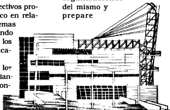
Biblioteca pública de Vallecas. Alzado posterior

los planes y líneas de acción de la administración regional en este tema. (Medida prioritaria).