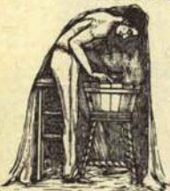
Antigua y rústica manera de protestar en su domicilio particular.

H A sido muy bien recibido en los medios de la oposición, dentro de un orden, el nuevo Desfogador Individual Domiciliario, en el que se pueden vomitar sin miedos ni reservas todas las palabras y frases que tiene usted atragantadas por el famoso aquél tan conocido.