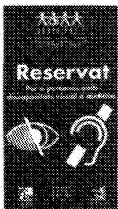
Etiqueta de reserva de plaza

En primer lugar se buscó una solución estructural, intentando que todas las aulas tuvieran unas condiciones óptimas para su uso por parte de cualquier alumno. Esta solución, técnicamente posible, sin embargo es difícilmente accesible por la economía de la UVEG o cualquier otra universidad de las mismas características. Queremos recordar aquí que la UVEG tiene en la actualidad, próximo su quinto centenario, cerca de sesenta mil estudiantes y aproximadamente siete mil empleados entre personal docente y de servicios. Algunas de sus aulas no tienen ningún sistema de megafonía, otras disponen de sistemas de amplificación con micrófonos de