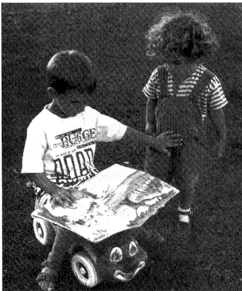
Alejandro del Mazo Vivar. "Los tres cerditos". El placer de leer . Biblioteca Municipal de Salamanca. 1997

Biblioteca Pública Municipal de San Isidro C/Ronda s/n 04117 San Isidro - Níjar (Almería)