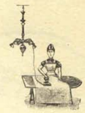
3. Señora de un inquisidor planchando la blusa de su marido, manchada la vispera con gotas de sangre.