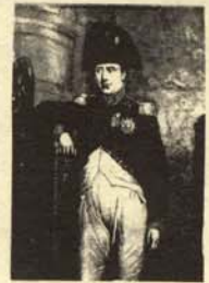
6. Simpático inquisidor disfrazado de Julio César en una fiesta familiar.