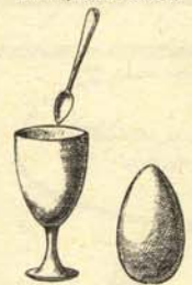
5. Huevo duro y copa para huevos duros usada por los inquisidores en sus cotidianos desayunos.