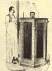
2. Cámara de torturas de pago instalada para uso de las clases pudientes en las oficinas de una Inquisición famosa.