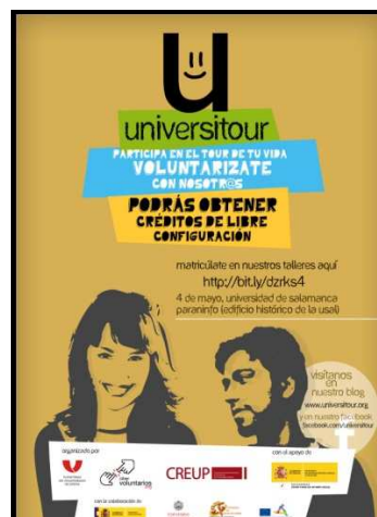
XXIII. Cartel UniversiTour

Junto a ello, es importante destacar que el objetivo de la investigación, no es la necesidad prioritaria de muchas organizaciones. Muchas poseen los voluntarios que necesitan, incluso algunas no podrían recibir a más personal voluntario o de prácticas; las ONG tiene una necesidad más importante en este momento: los recortes y la crisis económica ha provocado que sobretodo las instituciones más pequeñas tengan problemas para financiarse, para tener personal contratado y debido a ello no puedan mantener algunos programas.