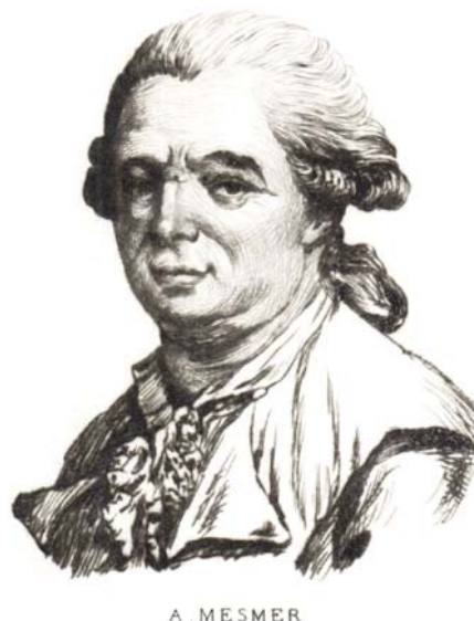
Foto 1: Franz Anton Mesmer (1734-1815).