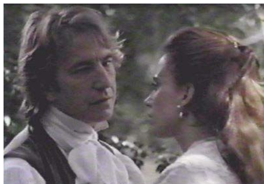
Foto 3: Alan Rickman (en el rol de Franz Anton Mesmer) y Amanda Ooms (como Marie Theresa Paradies o Paradies) en una escena del filme Mesmer (1994).

Sinopsis Retal biográfico del médico alemán del siglo dieciocho Franz Anton Mesmer (foto 3), quien se valió de prácticas médicas curativas heterodoxas basadas en su teoría del magnetismo animal.