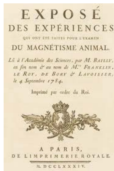
Foto 2: portada del informe ordenado por Luis XVI sobre las prácticas médicas de Franz Anton.

Si bien en 1781, publicó: Précis historique des faits relatifs au magnétisme animal , en 1784, Luis XVI, menos atraído que María Antonieta por las prácticas mesmerianas, formó una Comisión Real con cuatro miembros de la Facultad de Medicina y cinco, de la Academia Real de Ciencias (entre ellos: el químico Antoine-Laurent de Lavoisier, el astrónomo Jean Sylvain Bailly, el ministro plenipotenciario y científico estadounidense Benjamin Franklin y el médico Joseph Ignace Guillotin – paradójicamente propulsor del aparato que decapitó entre 1793 y 1794 al rey, a Bailly y a Lavoisier d –), a quienes ordenó analizar la falsedad o legitimidad de aquellas prácticas. Esta comisión realizó un conjunto de experimentos al efecto y concluyó que, sumado a la inexistencia de evidencias concretas sobre el magnetismo animal, los beneficios de la terapia estudiada residían en la imaginación y auto-sugestión de los pacientes (foto 2).