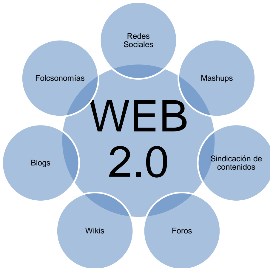
Gráfico 1: Definición grafica del término Web 2.0

Tal como se desprende de las líneas anteriores, el desarrollo de una Web 2.0 supone un cambio radical hacia una nueva etapa, abriendo a los usuarios de las nuevas tecnologías un amplio abanico de posibilidades hacia el saber. El siguiente gráfico ( Gráfico 1 ) muestra alguna de múltiples herramientas que integran la Web 2.0.