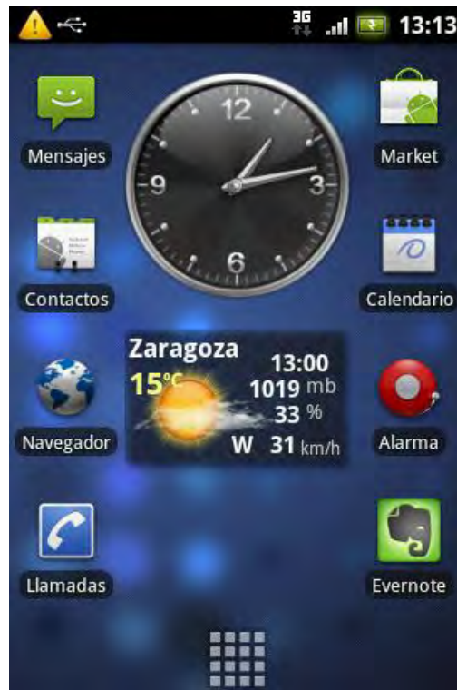
Gráfico 3: Widgets