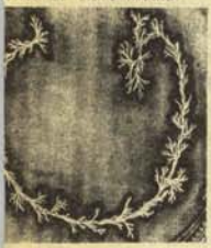
Virus de familias adine-