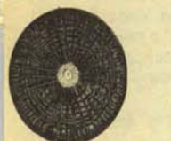
Virus procedente de ones de clase media.