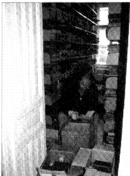
Selección y ordenación de los fondos

internacionales, como la gestión de los 127.000 dólares recogidos en EE.UU. y la adquisición de material básico de lectura y de oficina y proyecta la creación de la Biblioteca Virtual de Sarajevo dentro del proyecto Memoria del Mundo (11).