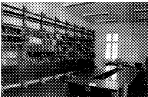
Sala de lectura

pero la falta de espacio obliga a la dispersión por las diferentes estancias, colapsando los improvisados depósitos y algunas zonas de paso. La acumulación de materiales y donativos han desbordado