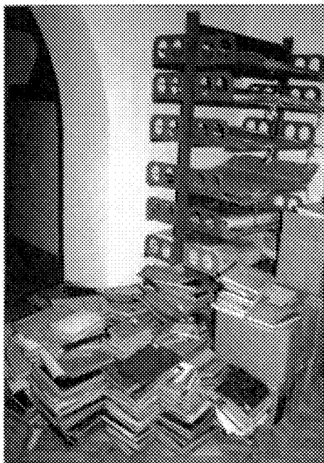
Colecciones especiales en espera

les, gran parte de la prensa periódica y las colecciones de préstamo (6). La UNESCO reconocía, por otra parte, la pérdida de 1.200.000 volúmenes, entre los que se encontraba la totalidad de las colecciones de prensa periódica, unos 600 títulos (7). Durante la guerra, los volúmenes salvados fueron conservados en cinco localizaciones diferentes dentro de la ciudad con el fin de asegurar su pervivencia.