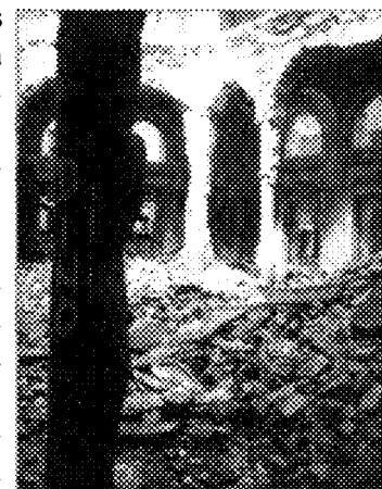
Vestíbulo de Vijećnica

El edificio conservaba, en 1992, cerca de 1.500.000 volúmenes de literatura general y científica, referencia y un número importante de manuscritos, colecciones de publicaciones periódicas y documentos de archivo de incalculable valor para el estudio de la