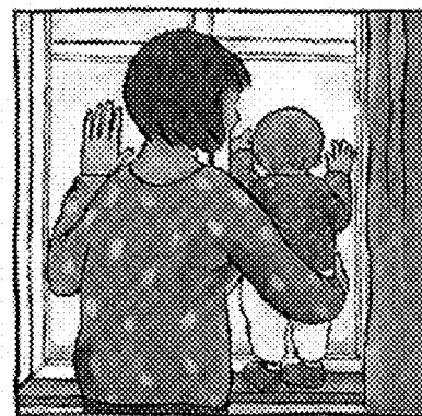
Jeanne Ashbé. ¡Adiós!. Corimbo 2000

Los orientadores/as de Preescolar na Casa también organizan actividades para fomentar la lectura con las bibliotecas de las zonas donde tienen a sus grupos; así, es muy