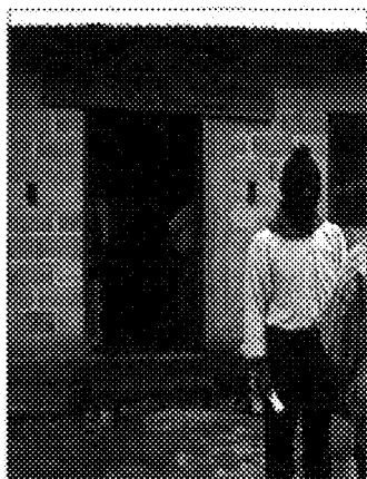
Biblioteca del Aguascalientes de Oventic

Si para hacerse oír el único camino posible era levantarse en armas, faltaban éstas. En una entrevista de los primeros meses de