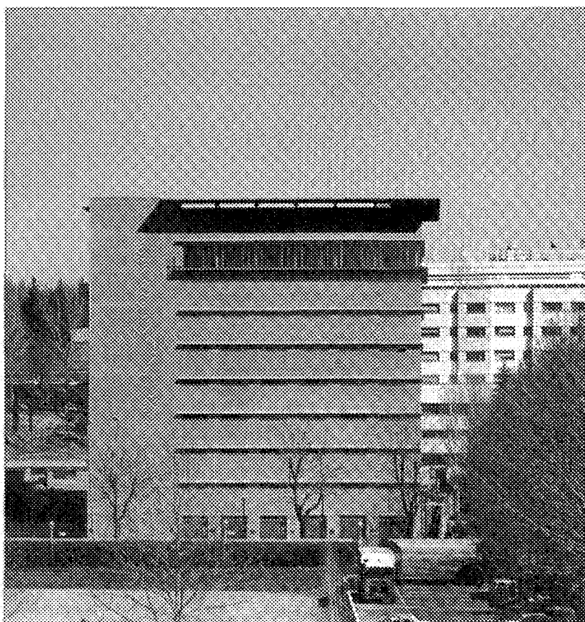
Fachada de la Biblioteca Central Universitaria de la UNED en Madrid

para su creación, "se constituirá previamente una Fundación regida por un Patronato" (9). Además, podemos decir que son organismos autónomos, que dependen de la Sede Central para asuntos académicos pero cuya financiación proviene de entidades públicas o privadas, siendo su objetivo último el servir de nexo entre el alumnado y la Sede Central.