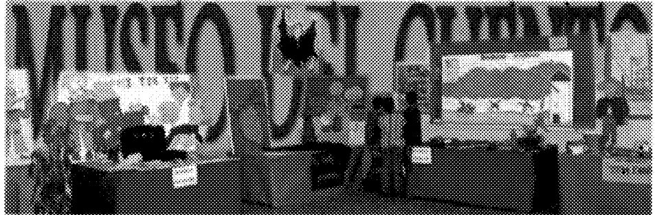
Una vista panorámica del Museo del Cuento en el Colegio "José M a de Calatrava" (Mérida)