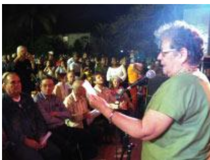
MI POGOLOTTI QUERIDO