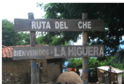
La pupila de un cubano en La Higuera CHE DESDE LA MEMORIA