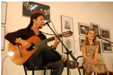
CARLOS LAGE VUELVE A LA HABANA