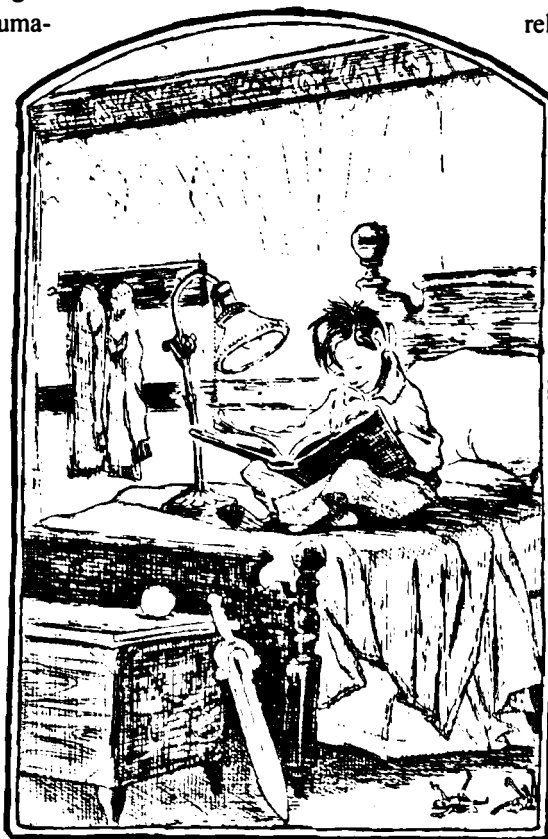
Spiderwick. El libro fantástico. Ediciones B. 2003

La biblioteca escolar no puede pensarse exclusivamente como un equipamiento necesario para mejorar la calidad de la escuela actualmente existente, sino