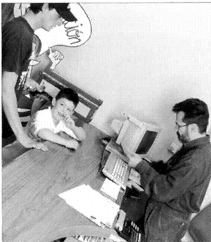
FGSR. Memoria 1996/97. 1997

Con esta argumentación, entiéndase bien, no se pretende sacar de la escuela la idea (utopía) humanista de formar hombres cultos, amantes de la lectura, de la música y del arte, capaces de expresar y transmitir emociones o de gozar de la naturaleza, sino que se trata de colocar todo esto en su contexto y en su sitio. La escuela puede y debe educar para el ocio y el tiempo libre, pero su papel esencial, el que más trascendencia individual y social tiene, es formar para el negotio , promover las habilidades y el hábito de estudio, el placer del trabajo intelectual, el placer de aprender si posible fuese; la escuela debe esforzarse más por trabajar para que los niños y jóve-