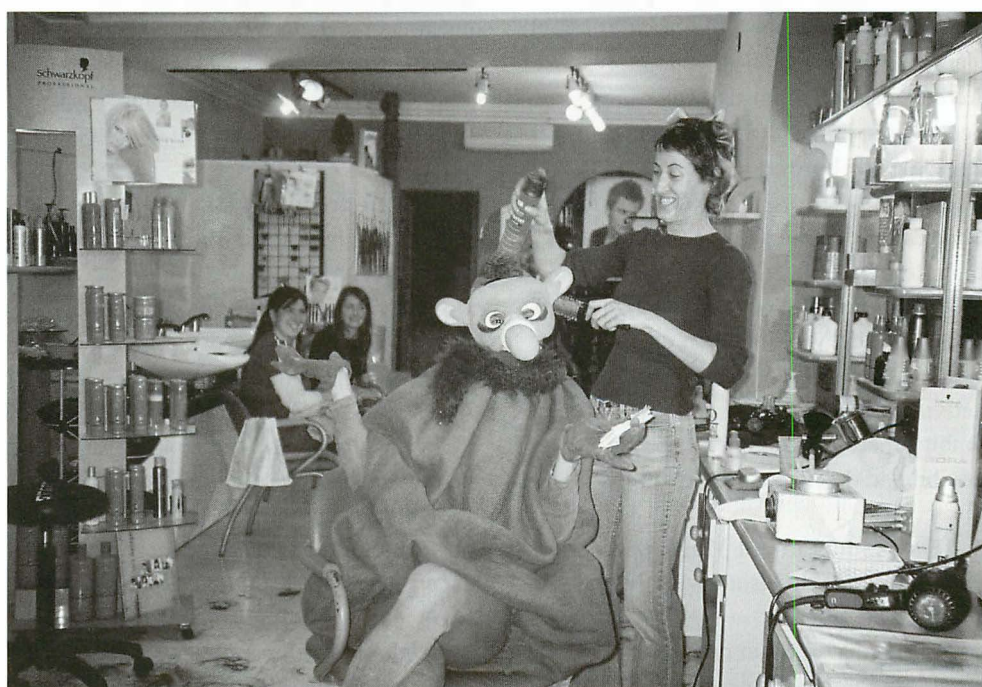
El desarrollo de Mi Ciudad en un Juego incluye actividades en espacios y locales públicos del municipio

La coordinación local del Programa está asumida en su totalidad por los