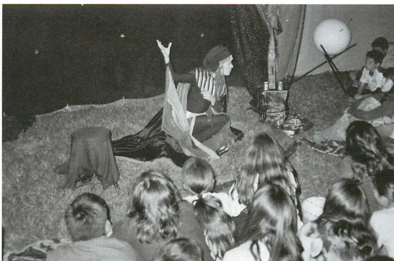
Las propuestas y personajes ligados al Programa Biblioteca-Escuela se convierten en parte de la actividad cotidiana de los niños a lo largo de todo el curso escolar

El hecho de que la gestión global se localice permite personalizar mucho más el proyecto y las actividades que se llevan a cabo como parte de su desarrollo. Las decisiones de incrementar el número de actividades del Programa, o de dar cabida a un mayor número de centros educativos o bibliotecas, son decisiones que atañen de forma íntegra y única al Ayuntamiento, y en la toma de las mismas la Fundación