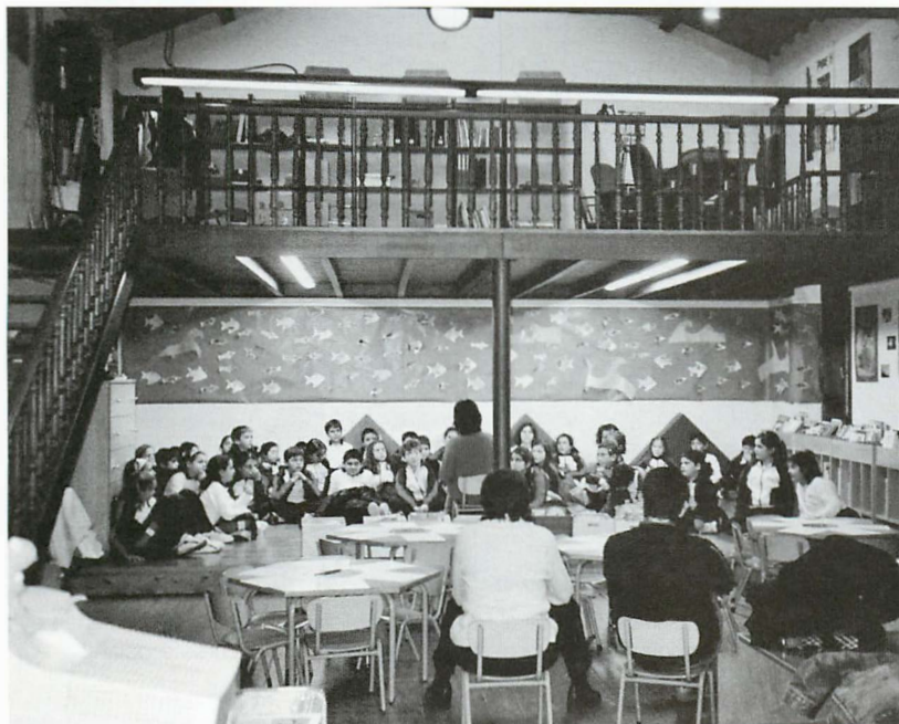
La organización de visitas a la biblioteca del municipio contribuyen a reforzar los lazos de cooperación entre los diferentes agentes implicados en el fomento del hábito lector

En el mes de julio lanzamos la convocatoria para la recepción de solicitudes y hemos recibido varias decenas de formularios de municipios con los que ahora estamos iniciando la ronda de contactos.