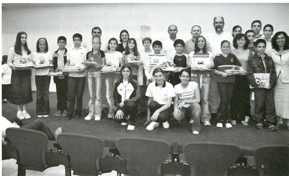
El Concurso de Creación Le@-Lectores Activos premia la creatividad de los alumnos en tres modalidades: Ilustración, Relato y Web

Sí, MagoAzul es un personaje principal en el Programa Biblioteca-Escuela; un eje, como tú bien has dicho. Se trata de un