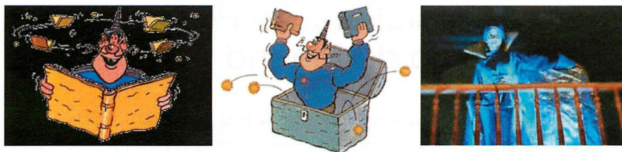
El MagoAzul es un personaje clave del Programa Biblioteca-Escuela que no sólo existe sobre el papel: personas reales lo encarnan para invitar a los niños a entrar en el país de los libros

de biblioteca pública, pero si además dispone de otros recursos culturales y educativos, los canales de aplicación y difusión del Programa se diversifican y su incidencia es mayor.