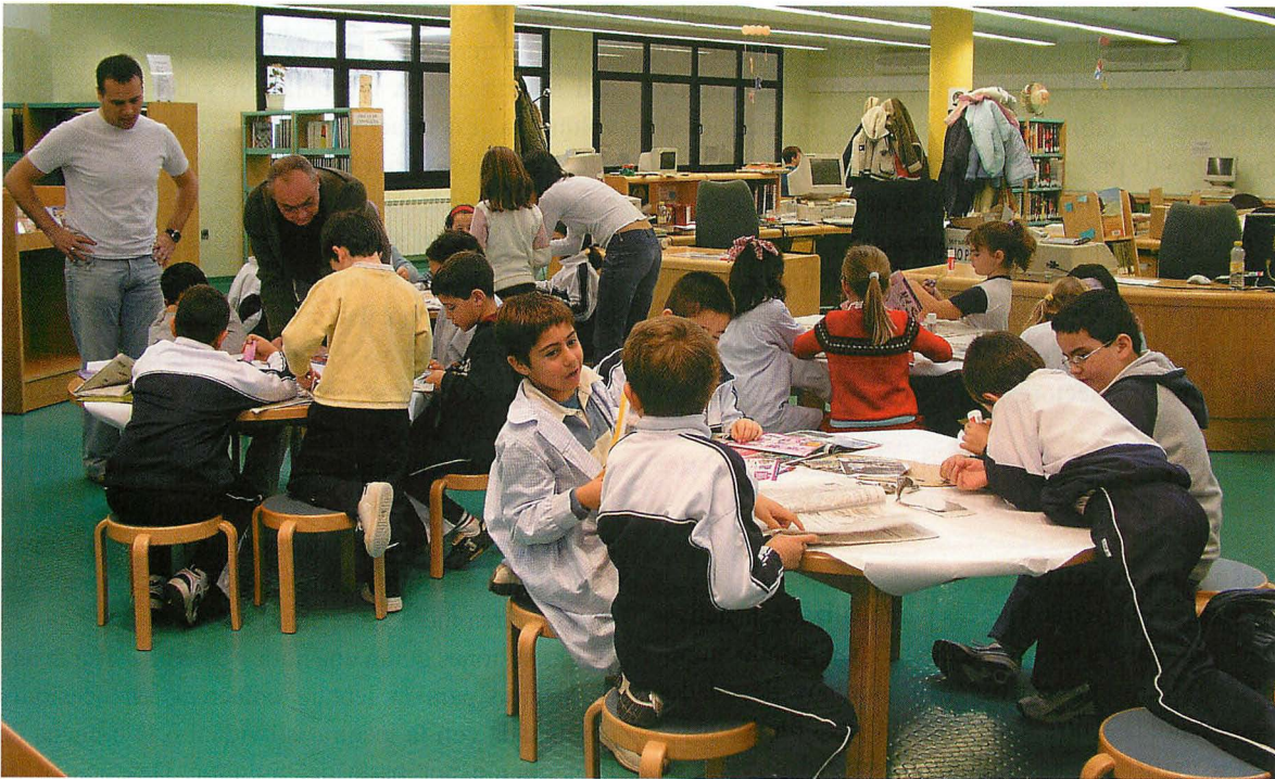
Visita de un colegio realizando actividades de Animación en la BPE de Cuenca

sesos educativos tanto para niños como para padres y educadores. Hay cinco puestos y las sesiones están limitadas a 30 minutos y fundamentalmente lo usan niños para jugar en la sección de pasatiempos. Las páginas que ofrecemos se revisan y actualizan periódicamente y vamos a poner a disposición de los niños una hoja de sugerencias para que ellos mismos nos recomienden páginas de Internet. El total de sesiones que se han realizado en el año 2004 han sido 2.738.