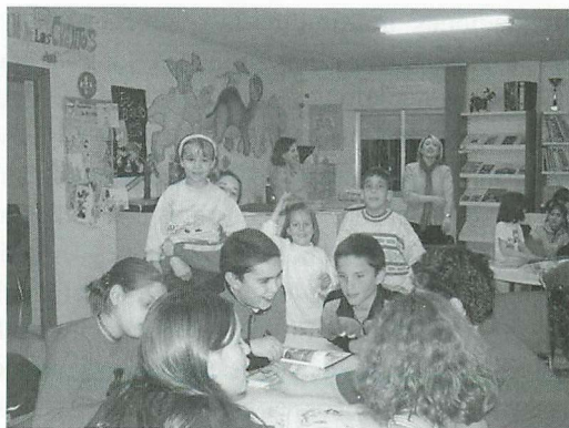
BPM de Ciudad Real

Las visitas colectivas proporcionan a la biblioteca difusión, nuevos usuarios, y establecen relaciones y colaboraciones con los centros educativos. La biblioteca proporciona a los niños un espacio atractivo, ayuda en su formación, un encuentro con los libros distinto al escolar, y para alguno de ellos el descubrimiento de una nueva afición: la lectura.