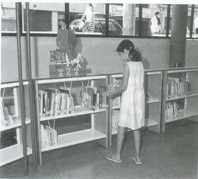
Sección Infantil de la BPE de Albacete

oral de historias tiene una magia especial y la biblioteca es un espacio ideal para esta práctica. En la BPE en Cuenca los cuentacuentos se realizan en la misma sala infantil, ya que dispone de un espacio muy atractivo para estas sesiones (una grada semicircular ubicada en la zona que usan los más pequeños). Sin embargo, esta actividad plantea algunos problemas. La biblioteca se ve obligada a suspender los servicios durante las sesiones de cuentacuentos, y esto no es del agrado de algunos usuarios. Otra cuestión que hay que mejorar es que los narradores tienen un repertorio que desconocemos, por lo que no tenemos preparados los libros en los que están basados las historias que cuentan, para que los niños puedan leerlos después o llevárselos en préstamo. Hay narradores que usan el libro como apoyo para contar las historias, pero otros utilizan otras técnicas sin hacer referencias a los libros.