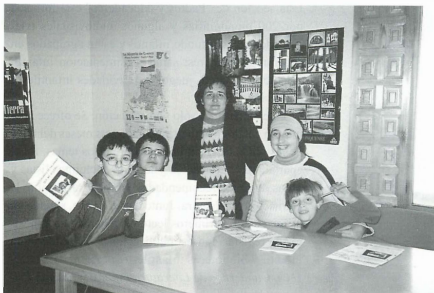
BPM de Albendea

La sala infantil dispone en libre acceso de un total de 24.584 documentos (7), del que 22.593 (90%) son monografías. Si aplicamos el indicador de volúmenes por habitante (8) nos ofrece la siguiente ratio: sobre el total de la colección: 2,9, monografías: 2,65.