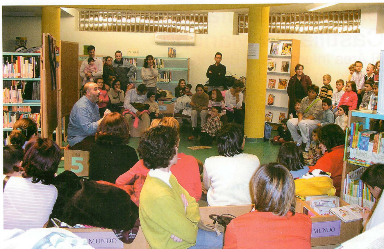
Una de las sesiones de cuentacuentos de los viernes en la BPE de Cuenca

estándares y los programas de ayudas. La realidad de estas bibliotecas es que la mayoría atienden a poblaciones de menos de 2.000 habitantes, tienen menos de 100 m 2 , un horario reducido y poco personal. Suelen usarse mayoritariamente por niños como biblioteca escolar. Esta situación viene dada en parte por la especial estructura demográfica de Castilla-La Mancha, pero es verdad que ha posibilitado llevar servicios públicos de lectura a gran parte de la población. Además hay que tener en cuenta que, para las poblaciones de más de 2.000 habitantes, la cobertura es casi del 100%. El incremento de fondos de los últimos años se mantiene constante y están formando colecciones por encima de los dos volúmenes por habitante, con inclusión de audiovisuales en la mayoría de ellas y una presencia de soportes electrónicos cada vez mayor. Casi un tercio de ellas corresponden a fondos infantiles.