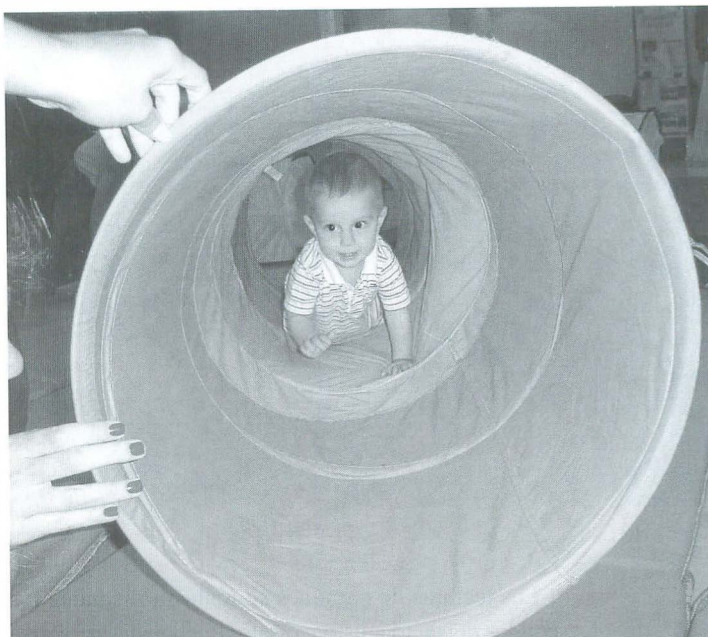
¿Dónde está el bebé?

Constituye el espacio básico de El rincón del bebé . Se caracteriza por la creación de un continente afectivo, hecho de cubrecamas, sábanas, almohadas, cojines y libros seleccionados y apropiados para niños y niñas en edades tempranas, donde toda la familia tiene un lugar para compartir con los bebés, la lectura de un cuento, una canción, un títere, juegos de aparecer