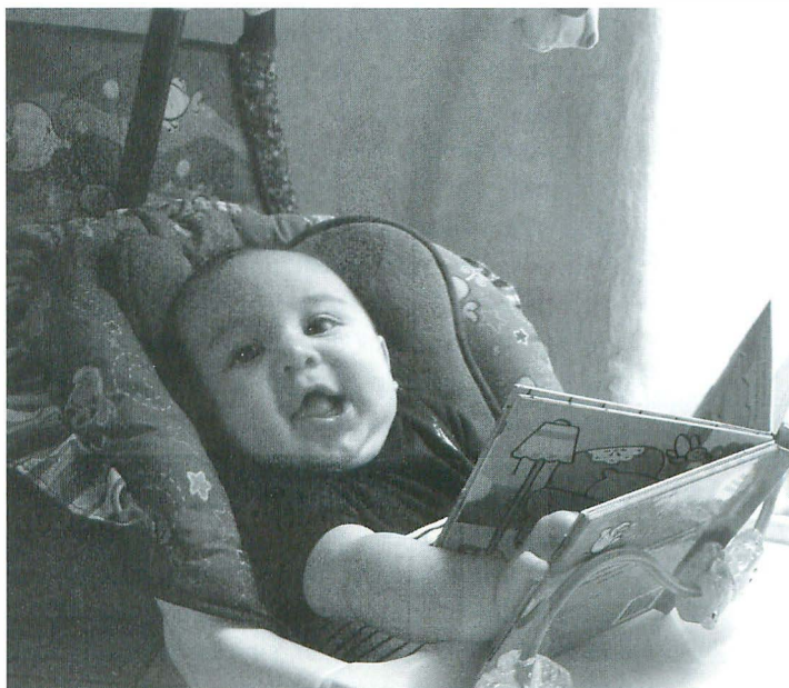
El bebé y su libro

Trabajamos desde la palabra que acompaña, propicia, provoca sensaciones gratas de bienestar en el bebé y lo dispone afectivamente a la escucha, a la apertura de un espacio de relaciones donde se implica su naturaleza biológica, psíquica y social. El cuerpo y la palabra se unen, se sincronizan, cobran vigor en la acción compartida con el otro, que dan fe de su mutua pre-