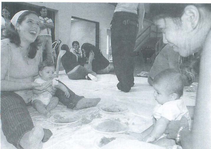
Rincón del bebé

Las lecturas de patuques se realizan mediante los sentidos del tacto, gusto y olfato. Pueden desarrollarse en un espacio abierto o cerrado. El propósito es favorecer el enriquecimiento del imaginario del niño y la niña a través de las sensaciones corporales e, igualmente, la oportunidad de experimentar procesos de transformación provocadas por él o ella, en su acción sobre la materia.