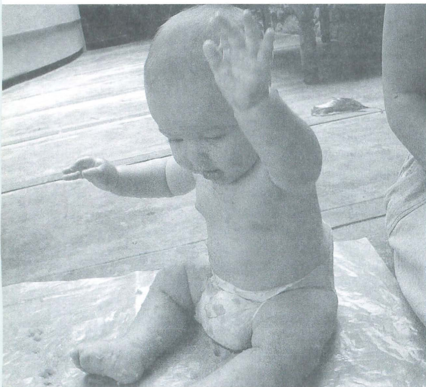
Lectura de patuque

Duerme mi tripón vamos a engañar la lechuga y engañar al coco que ya no asusta duerme mi tripón. Que mañana el sol brillará en tu cuna