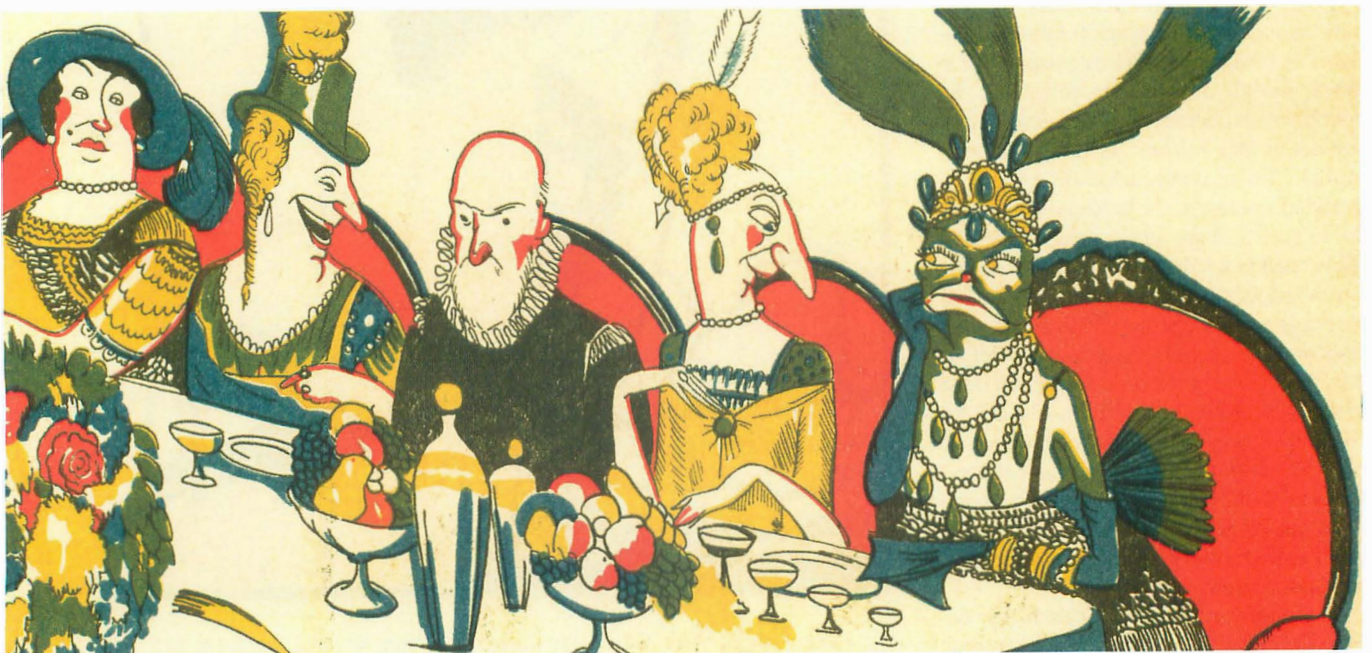
Fig. 4. [s.a.] La traición del hada Ranilde . Cuentos de Calleja en colores , 4ª serie, vol. 35. Madrid: S. Calleja, 1918 (detalle).

En La princesa más fea del mundo y su continuación, La traición del hada Ra-