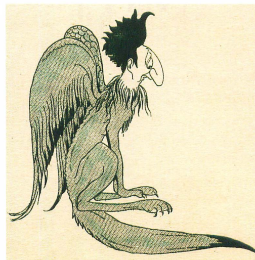
Fig. 6. -Detalles de figuras fantásticas tomadas de diferentes cuentos ilustrados por J. Zamora.