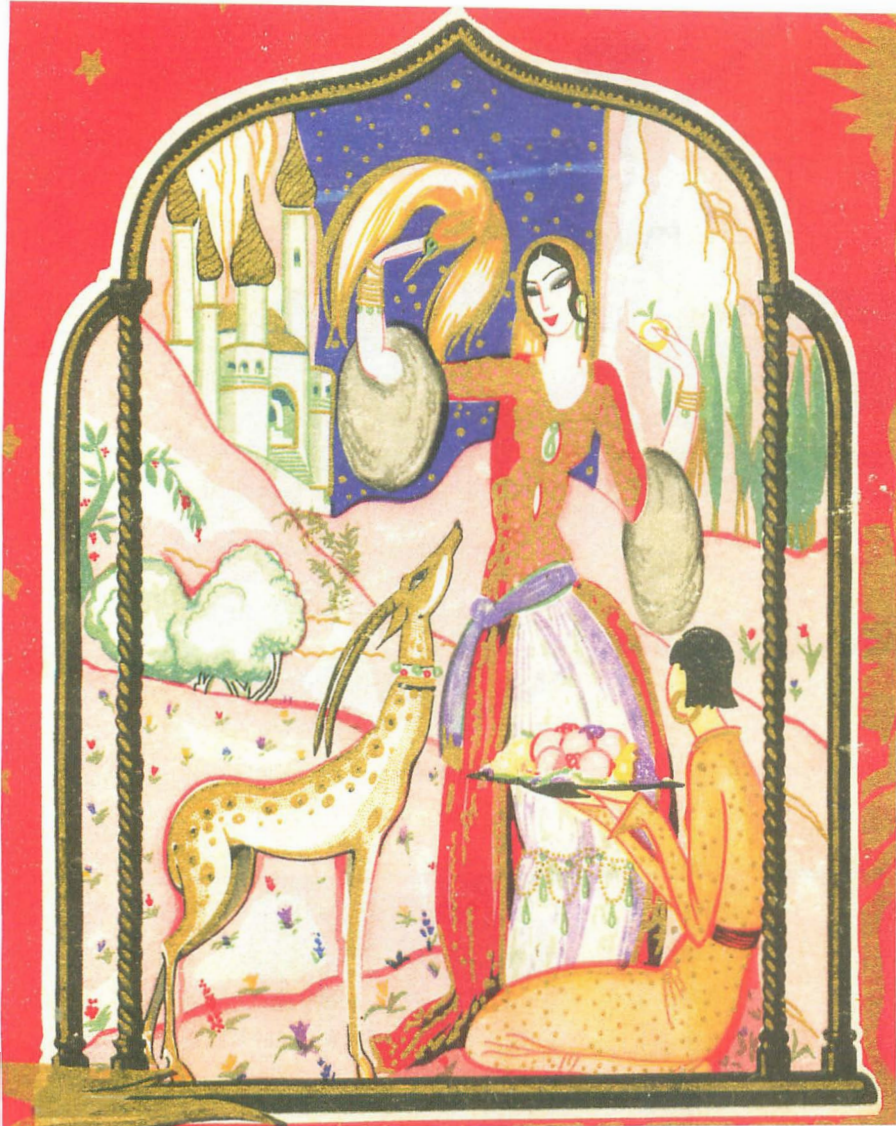
Fig. 3. [s.a.] La cierva blanca . Biblioteca Perla, 1ª serie, vol. 21. Madrid: S. Calleja, 1941(cy).

todo el relumbrón que las adorna y nos enteremos, de una vez, que aunque se les ofreciera la quincalla más costosa en crímenes que se pueda imaginar, ellas seguirían lívidas e insatisfechas.