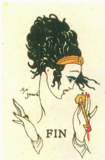
Fig. 9. (s.a.) Barba Azul . Cuentos de Calleja en colores , 4ª serie, vol. 7. Madrid: S. Calleja, 1917.