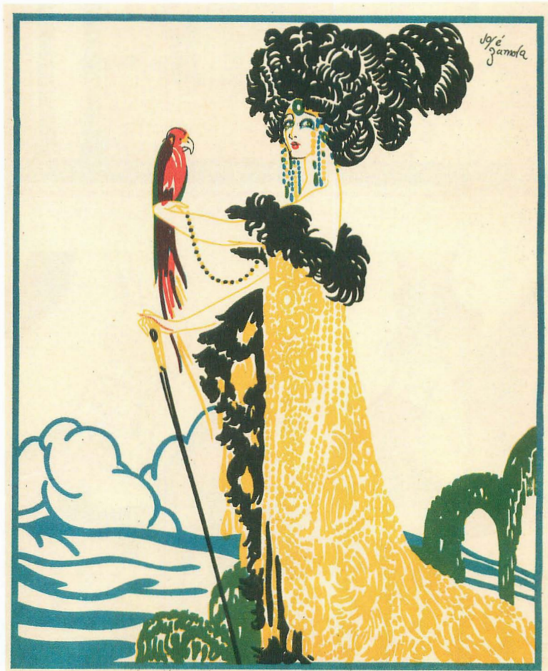
Fig. 2. [s.a.] Blancanieves . Cuentas de Calleja en colores , 4ª serie, vol. 6. Madrid: S. Calleja, 1917.

Estas mujeres de papel pasan por delante del encuadre y se paran frontalmente ante nosotros para que podamos admirar