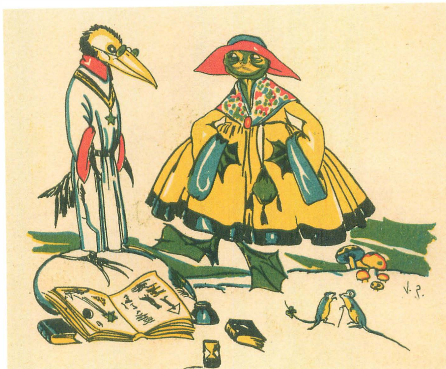
Fig. 5. (s.a.) La traición del hada Ranilde . Cuentos de Collejo en colores , 4ª serie, vol. 35. Madrid: S. Collejo, 1918.