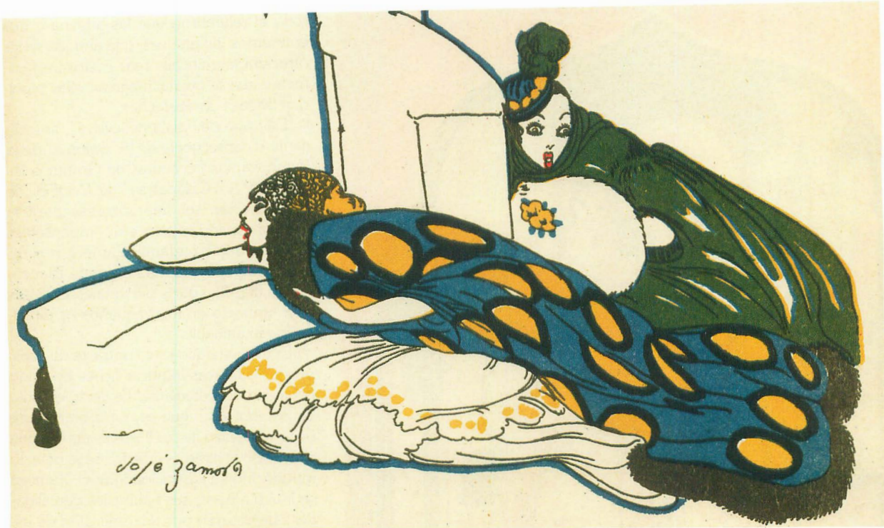
Fig. 1. [s.a.] Barba Azul . Cuentas de Calleja en colores , 4ª serie, vol. 7. Madrid: S. Calleja, 1917 (detalle).

corta estancia, parece que se establece en esta ciudad cerca de 1920. Por los comentarios de Nieva deducimos que su éxito en el campo que verdaderamente le interesaba fue total.