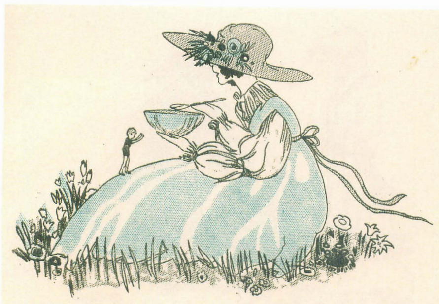
Fig. 8. Nesbit, E. Cuentos de Nesbit . Biblioteca Perla, 1ª serie, vol. 22. Madrid: S. Calleja, 1922.