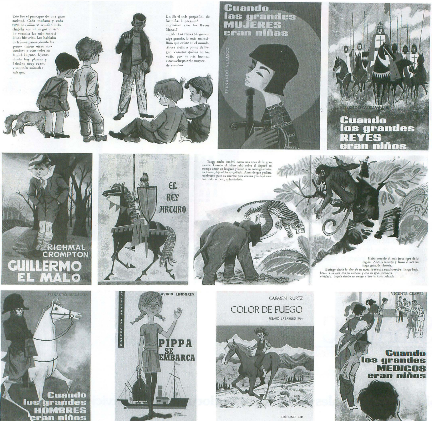
Fig. 3.- Cubiertas e ilustraciones de libros para lectores infantiles

constancia en las editoriales Molino, Juventud, etcétera. Al saber de la exposición en el Muvim y saber de su origen en Linares, Jaén, asumí que Valencia debió ser su patria de acogida, pero no; la sosegada lectura de su biografía en el catálogo citado me llenó de esperanza: nacido en Jaén, estudiado en Madrid, afincado en Barcelona y editado en toda España, es homenajeado y recuperado en Valencia...; en nuestro país hay autonomías que te reconocen aunque no hayas pintado, escrito, fotografiado o pensado en autonómico.