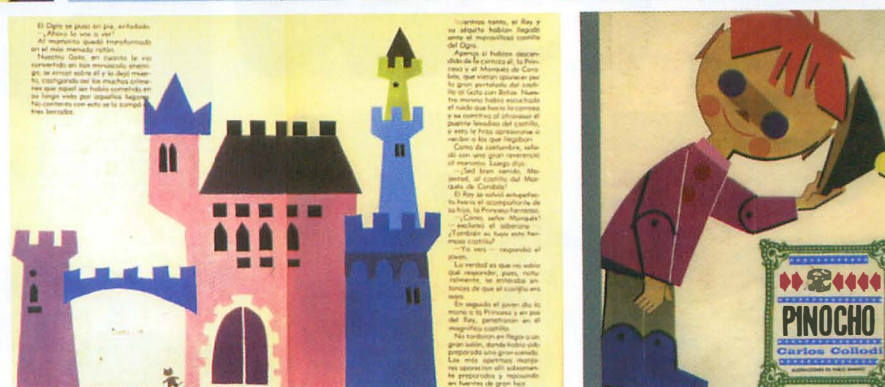
Fig. 2.- Cubiertas e ilustraciones de libros para pre-lectores

Cuando su figura no era para mí nada más que el más importante de todos los ilustradores de mi infancia, convine conmigo mismo en que sería catalán, dada su