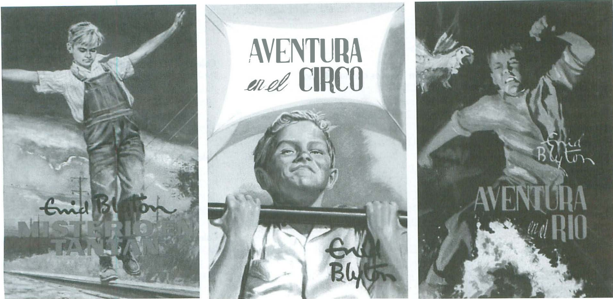
Fig. 4.- Cubiertas de libros preadolescentes de aventuras