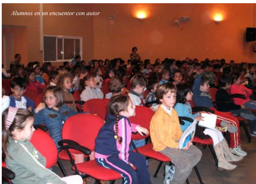
Alumnos en un encuentro con autor