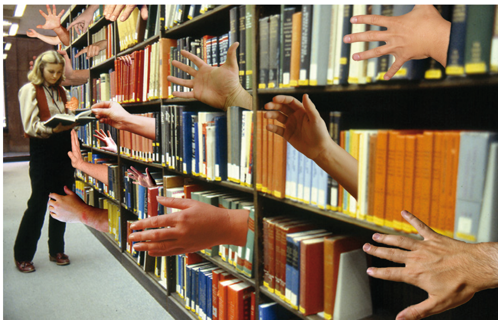
Ilustración: José Manuel Ubé.

—Esa pregunta es difícil de contestar. Una de las desventajas de residir en esta casa es que vivimos apilados en las baldas y sólo dejamos ver el trasero, es decir, el lomo, que en muchos casos es nuestro único reclamo para aquellos que pasean indecisos entre las estanterías sin saber qué escoger. Otras veces, el pasar de mano en mano depende del boca a boca de los que ya nos han escuchado antes. También dependemos bastante de las modas y de la publicidad, es decir, que nos solicitan