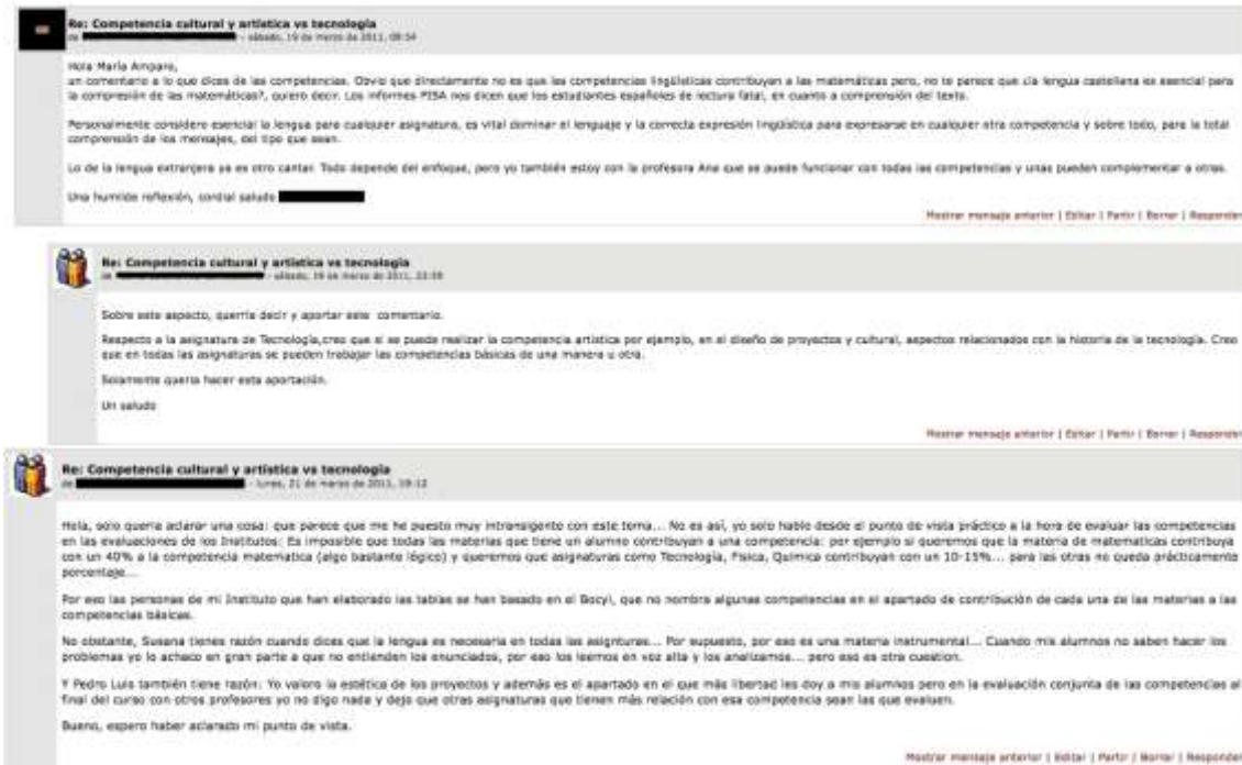
Figura 2: Algunas intervenciones en el foro

Al finalizar el curso, y con intención de valorar el desarrollo de la tutoría online a través de los foros y el empleo de los mismos como recurso de aprendizaje colaborativo, planteamos una encuesta de satisfacción, donde los participantes debían responder a los ítems que se muestran en la figura siguiente: el profesorado ha resuelto las dudas planteadas, los tutores están accesibles para ser consultados por los participantes en el curso (correo electrónico, foros, etc.) y la metodología utilizada favorece la comprensión y aprendizaje de los contenidos . Como se puede observar, las puntuaciones medias son altas (escala de 1-5, 1 totalmente en desacuerdo y 5 totalmente de acuerdo); en los dos primeros casos la media obtenida es de 4,5 por lo que es un valor muy elevado y en la tercera cuestión el valor es de 3,7 por lo que el grado de satisfacción de los participantes es evidente. Concluimos, por tanto que la experiencia resultó positiva para el alumnado.