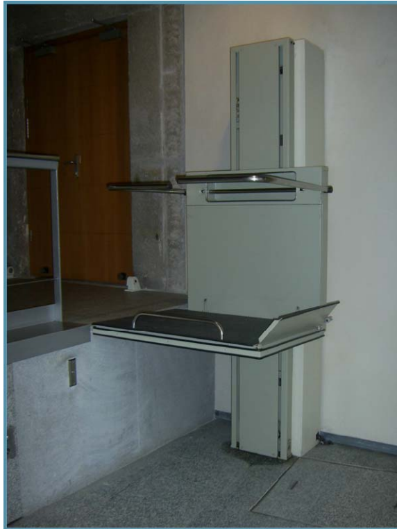
Imagen 10. Elevador del Centro Cultural Palacio de Los Serrano

2).- Inventario y señalización en el plano turístico de todas las plazas de aparcamiento para discapacitados. El plano turístico se entrega a todos los visitantes de la ciudad y se puede acceder también a través de la página web ( www.avilaturismo.com ) accesible.