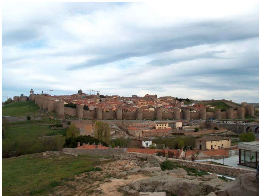
Imagen 11. Vista general de la muralla de Ávila

actualmente visitable en dos tramos de 1.100 metros, y a finales de 2007 se inaugurará un nuevo tramo con 700 metros y accesos accesibles. Se trata de ofrecer a “todos” los turistas la posibilidad de visitar nuestro primer monumento que, actualmente viene siendo visitado por 275.000 personas/año.