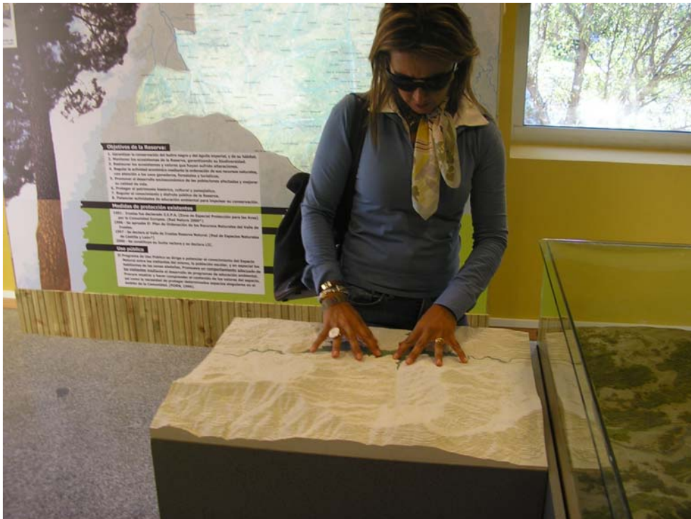
Imagen 13.- Maqueta para invidentes en la “Casa del Parque” de la Reserva Natural del “Valle de Iruelas” en Ávila

Para concluir, todas estas medidas han sido posibles gracias a la coordinación de los distintos Servicios Municipales (Obras, Urbanismo, Servicios Sociales, etc.) y, tal vez, el logro más importante que se ha conseguido es impregnar distintas políticas municipales con el principio de “accesibilidad”.