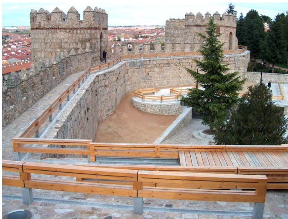
Imagen 12.- Vista del un tramo visitable del adarve de la muralla de ávila