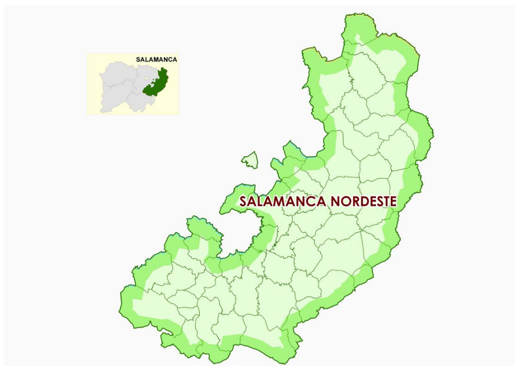
Mapa 1: Municipios comprendidos en la zona de Salamanca Nordeste