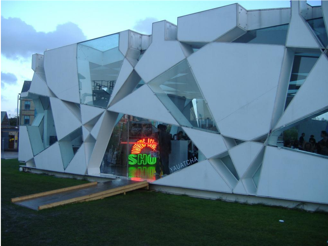
FIG. 6. Toyo Ito. Paellón de la Serpentine Gallery . 2002. Londres (Reino Unido).