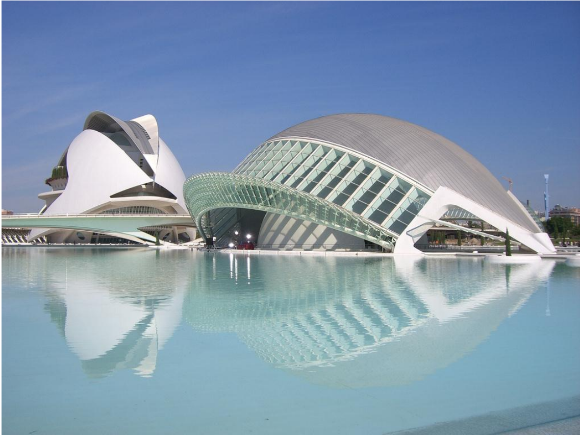
FIG. 3. Santiago Calatrava. Ciudad de las Artes y las Ciencias (vista panorámica del Planetario y del Palacio de las Artes). 1991-2006. Valencia (España).