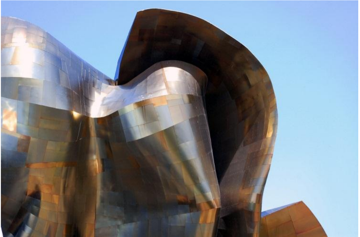
FIG. 5. Frank Gehry. Experience Music Project (detalle de la cubierta). 1995-2000. Seattle (Estados Unidos de América).