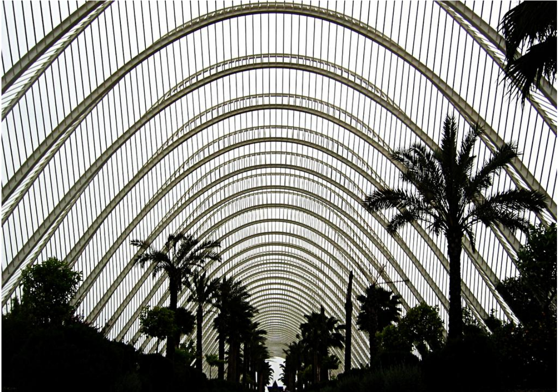
FIG. 4. Santiago Calatrava. Ciudad de las Artes y las Ciencias (detalle del Umbráculo). 1991-2000. Valencia (España).