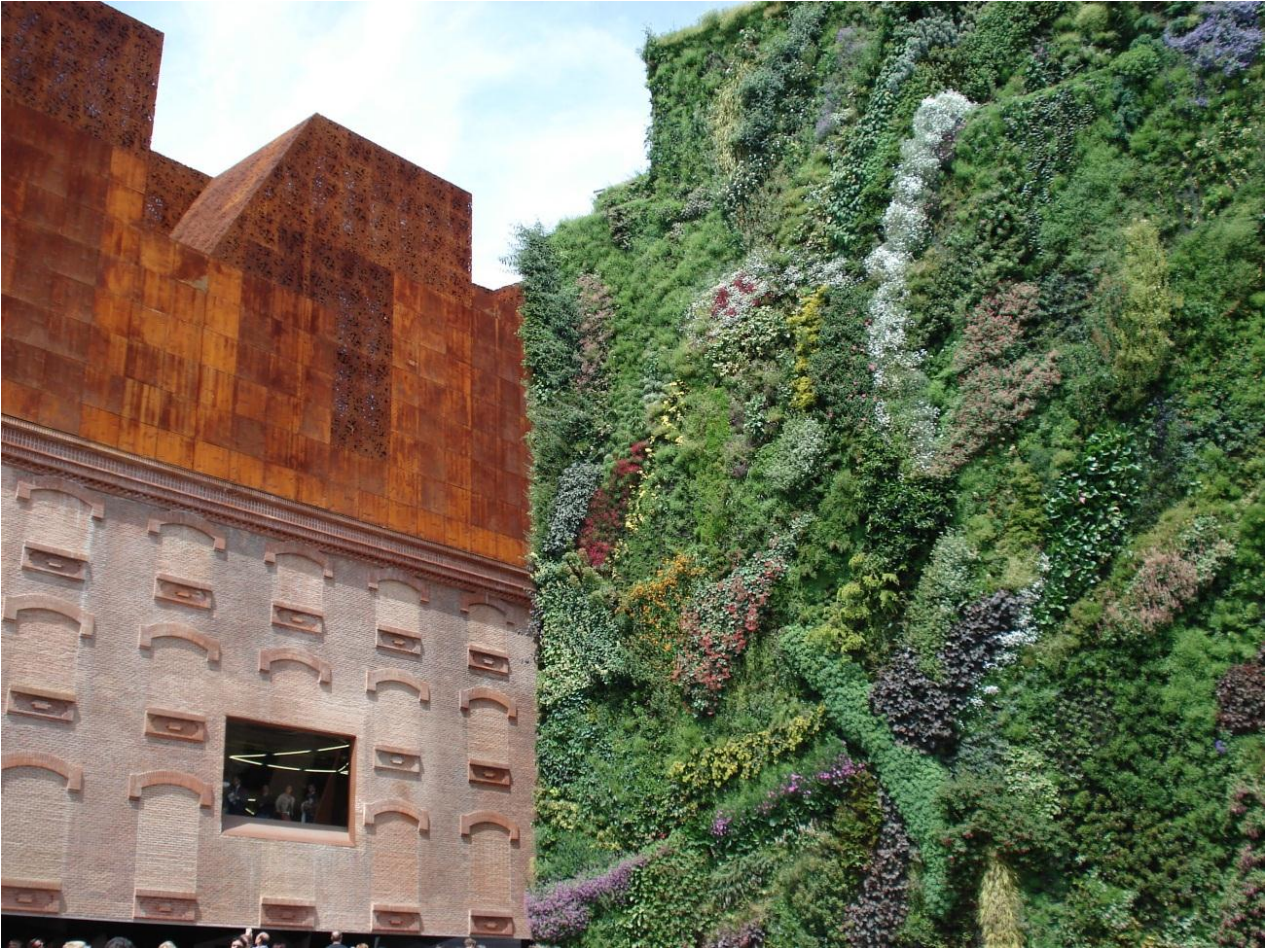
FIG. 1. Herzog & de Meuron. Edificio Caixaforum. 2001-2008. Madrid (España).