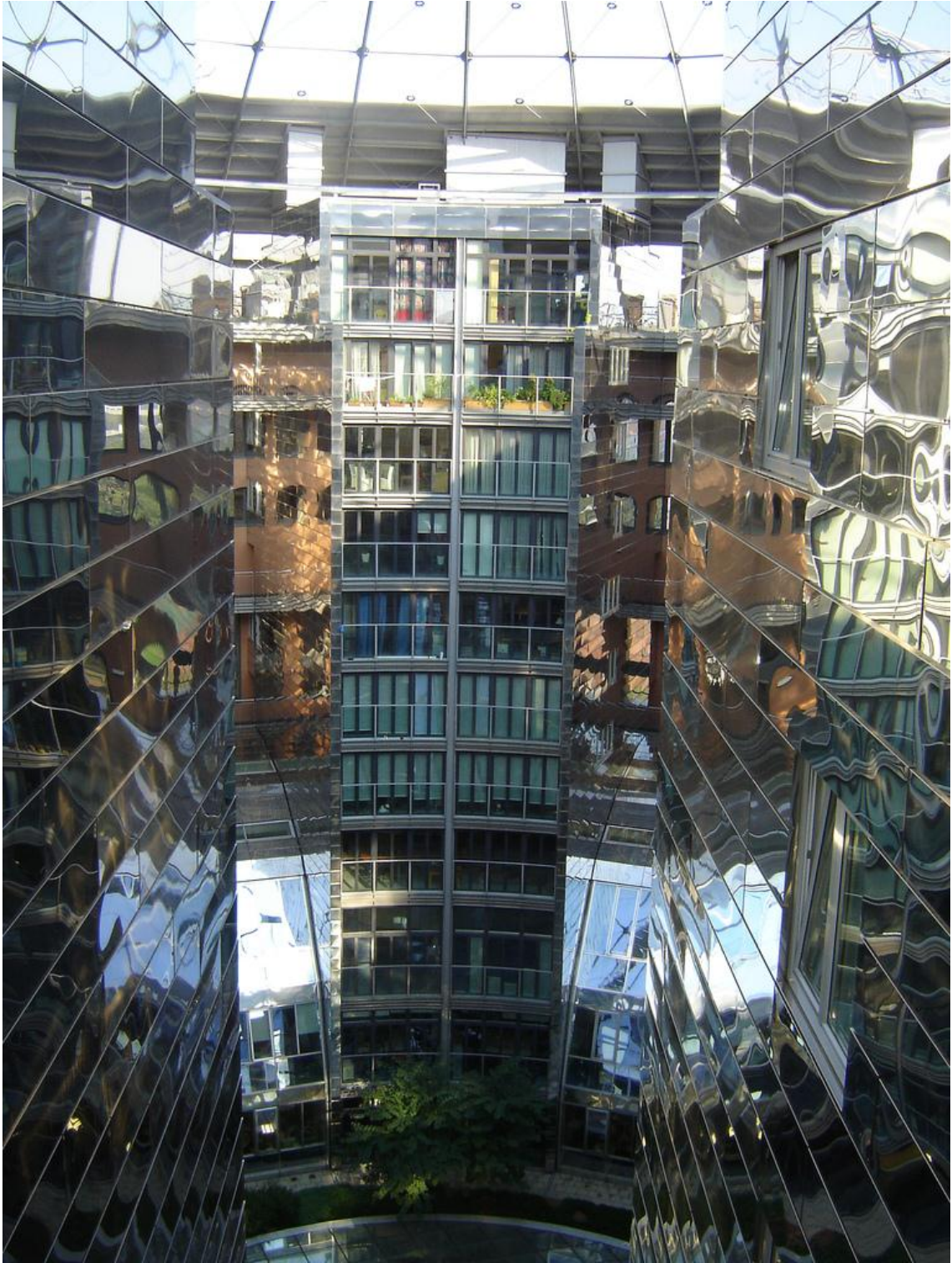
FIG. 7. Jean Nouvel. Viviendas-gasómetros (imagen del atrio interior). 1995-2001. Viena (Austria).