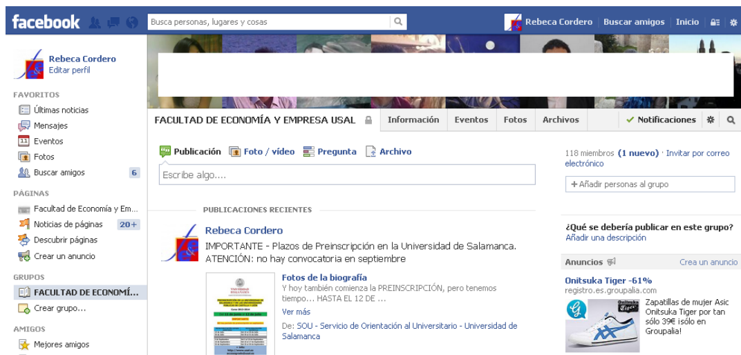
Imagen 4: Grupo Facebook de la Facultad de Economía y Empresa

información concreta de la Facultad de Economía y Empresa, que además sólo estuviese accesible a estudiantes y profesores de la misma. (Imagen 4)