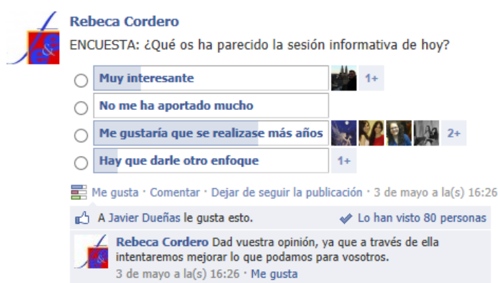
Imagen 7: Ejemplo de encuesta dentro del grupo Facebook de la facultad

En definitiva, valoramos que el proyecto ha tenido el éxito esperando teniendo en cuenta el poco tiempo que lleva en funcionamiento público. Es nuestro deseo continuar con la iniciativa en años sucesivos para aumentar no sólo la difusión y promoción de la Facultad de Economía y Empresa si no también aumentar la satisfacción de nuestros alumnos y profesores presentes, pasados y futuros. Y recomendamos la aplicación de este proyecto a cualquier otra facultad de esta y otras universidades.