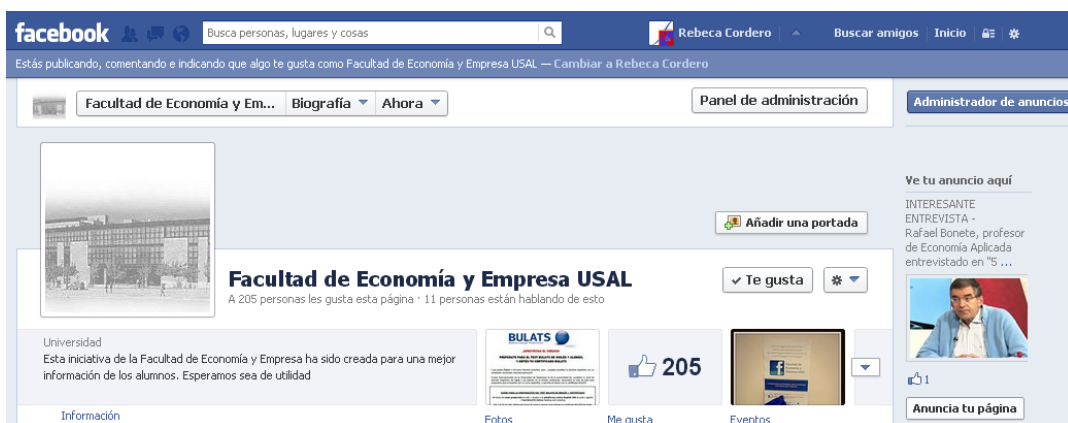
Imagen 3: Página de la Facultad de Economía y Empresa.