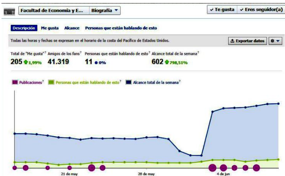
Gráfico 1: Descripción general de la página (15 de mayo a 15 de junio)

Por último, podemos ver que 602 personas (alcance total en la última semana) vieron o interactuaron con la página, lo que nos permite reforzar la idea de alta difusión de los contenidos de nuestra facultad no sólo entre actuales fans si no en personas ajenas. Esto nos lleva a pensar en que el crecimiento de la página aumentará en el futuro, ya que usuarios que regularmente vean contenidos en los perfiles de otros amigos terminarán por agregarse a nuestra página para ver el global de contenidos en tiempo real y con una notificación de los mismos.