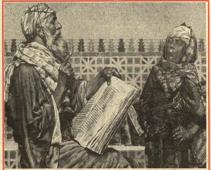
—Más fuerte: ¡¡US go homeeee!!