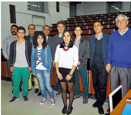
Los cinco candidatos a la Olimpiada Regional Matemática. | GALONGAR