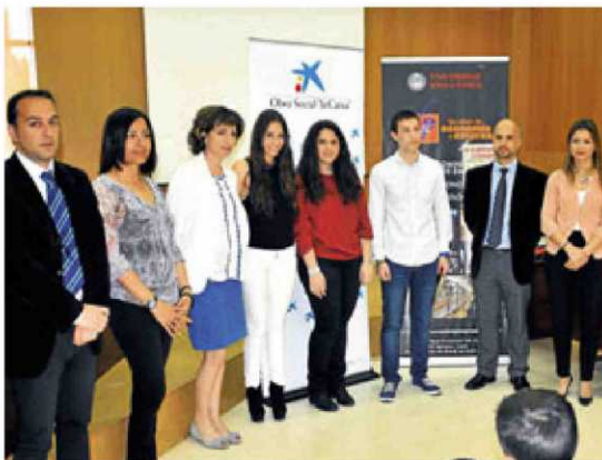
Los tres ganadores de la fase local de Olimpiadas de Economía.