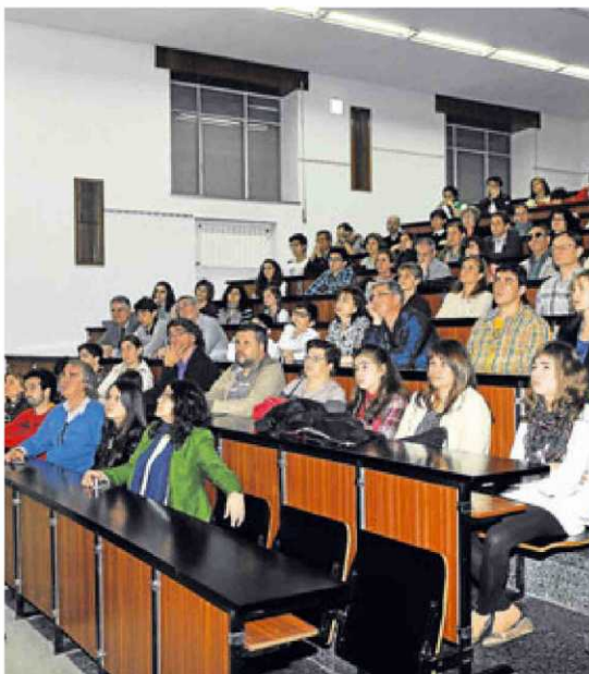
Asistentes al acto de clausuración de la Olimpiada matemática.