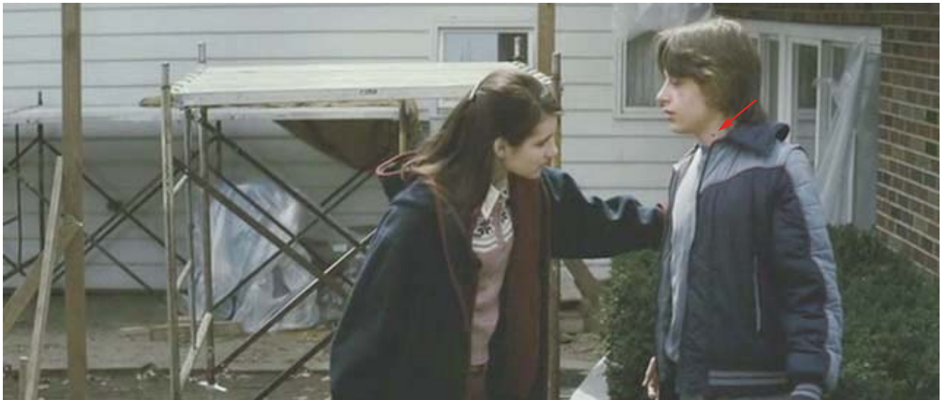
Trasmisión: picadura de Ixodes scapularis (garrapata de pata negra o del ciervo).