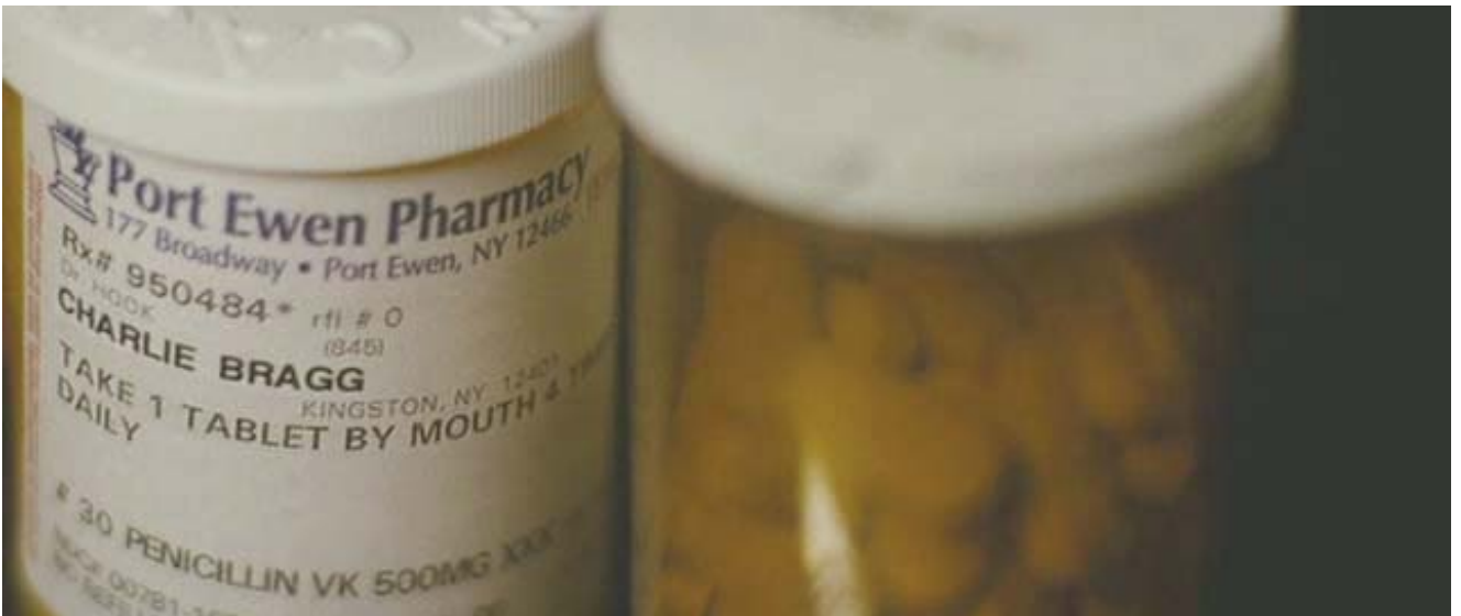
Tratamiento: penicilina V potásica.