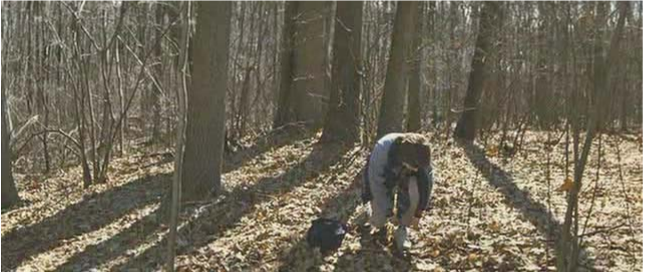
Prevención: barrera mecánica, sellado del pantalón con el calzado.