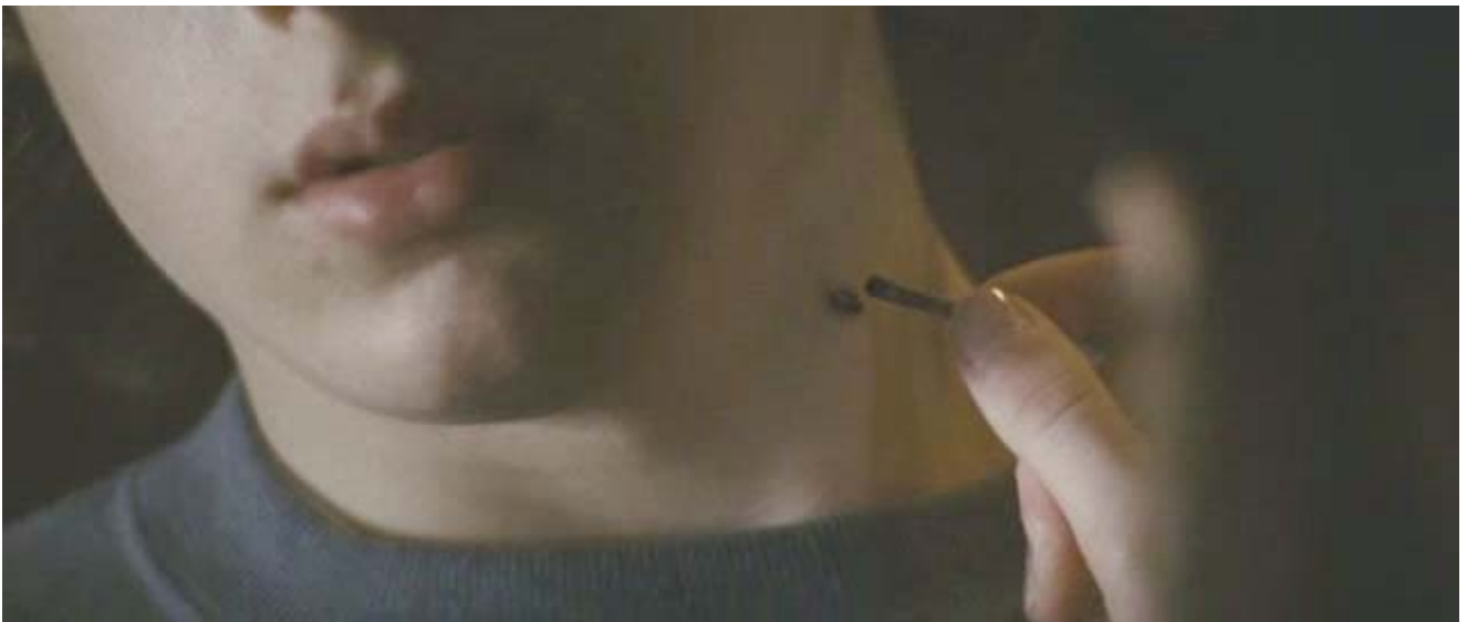
Prevención: extracción de la garrapata con unas pinzas puntiagudas, no usar otros procedimientos como un fosforo caliente.