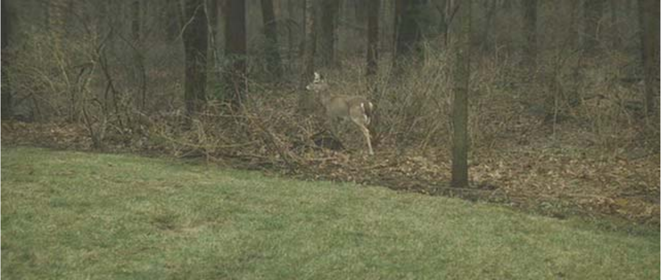
El ciervo de cola blanca ( Odocoileus virginianus ) esencial en el ciclo de la garrapata.