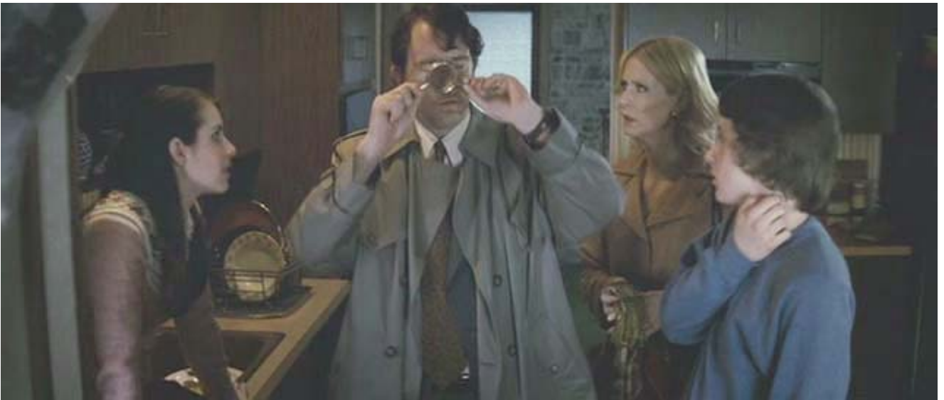
Caracterización de la garrapata.