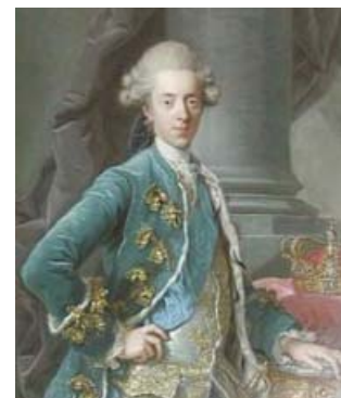
Foto 1. El triángulo amoroso real: Johann Friedrich Struensee, Reina Caroline Matilda de Gran Bretaña y Rey Christian VII de Dinamarca y Noruega.