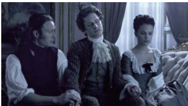
Foto 2. El triángulo amoroso ficcional: Struensee, Christian VII y Caroline Matilda

Holstein bajo el dominio de los reyes daneses. Allí, un aquejado conde Carl Rantzau comisiona a su amigo Enevold Brandt para que acuda en busca de un profesional que yugule su aficción.