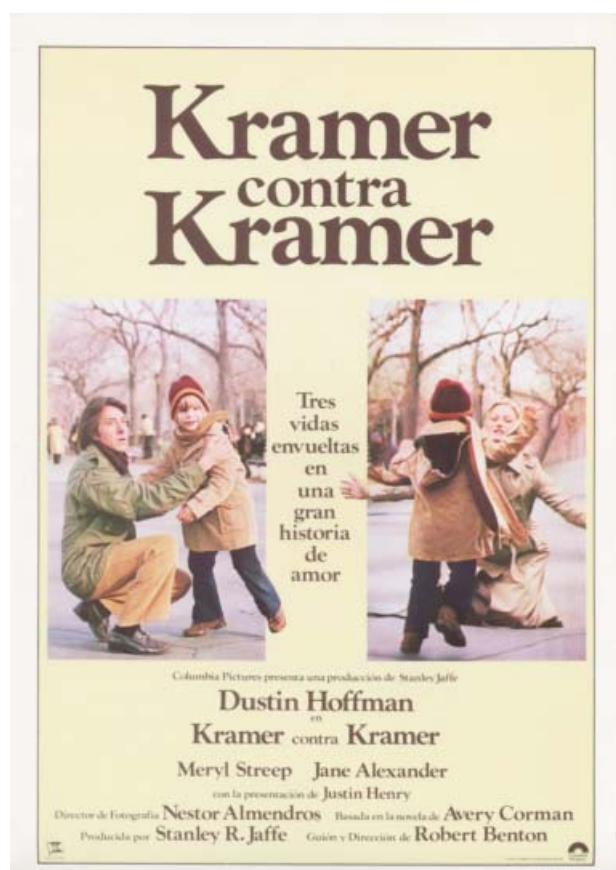
Foto 5. Por primera vez en la gran pantalla, el padre asume el papel de cuidador principal del hijo.

De esta manera, ella renuncia, sólo por citar unos ejemplos, al hijo en Kramer contra Kramer/ Kramer VS. Kramer (1979) de Robert Benton (foto 5); a la brillante carrera profesional en Una pareja de tres/ Marley&Me (2008); a la tesis doctoral en Un feliz acontecimiento/ Un heureux événement (2011) de Rémi Bezançon, (foto 6), no tanto porque se quiera representar una verdad (es decir, la conciliación es casi imposible, sin hacer mención de la corresponsabilidad), sino para resaltar que la renuncia y el sacrificio son valores encarnados y representados