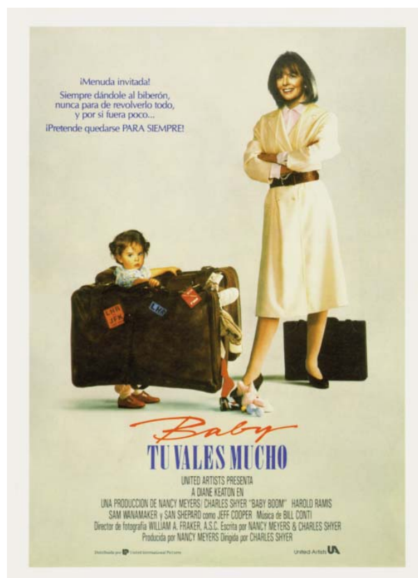
Foto 1. La business woman que se convierte en octopus mom .

y la conciliación de la vida laboral con la personal y familiar es una cuestión que incluso los medical drama han empezado a tratar, aunque solucionando el asunto con mucha sencillez. Así, por ejemplo, en Urgencias/E.R. (1992-2009) de Michael Crichton, la Dra. Elizabeth Corday (Alex Kingston) vive diversas dificultades a la hora de reincorporarse al trabajo tras su baja maternal, debido, sobre todo, a la lactancia materna (pérdidas de leche durante las operaciones). En los últimos episodios de Anatomía de Grey/ Grey's Anatomy (2005-presente) de Shonda Rhimes, tanto la protagonista, Meredith Grey (Ellen Pompeo), como otras médicas, Callie Torres (Sara Ramirez) y Miranda Bailey (Chandra Wilson), luchan para conciliar la brillante carrera quirúrgica con los horarios de la guardería