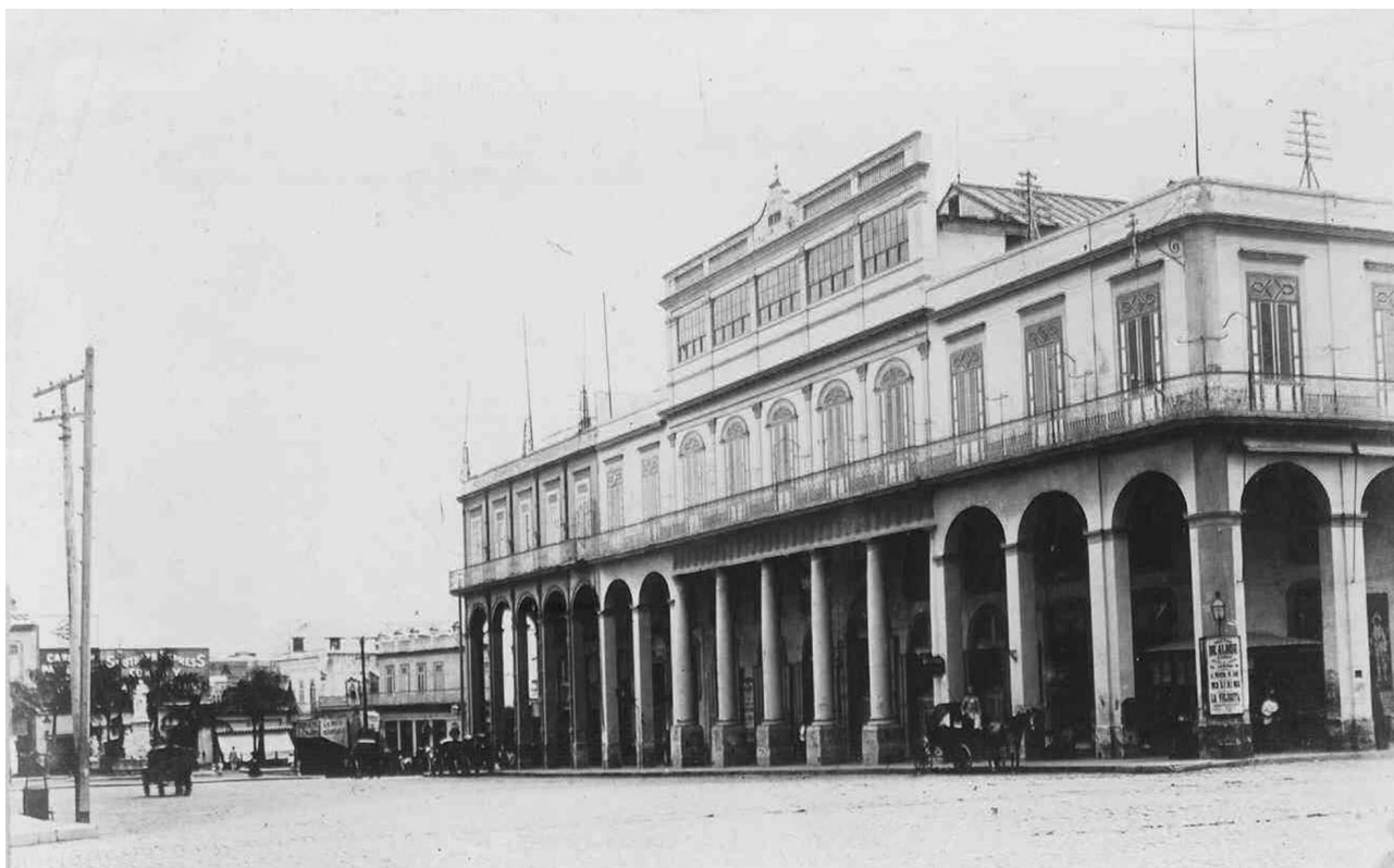
Fig. 3: El Teatro Alisu y el antiguo Centro Asturiano de La Habana, fachada a la calle San Rafael. (Archivo Nacional de Cuba, Fototeca).

oro, cantidad que se gastó en una fastuosa modernización no exenta de grandilocuencia, hecho que confirma las preferencias estéticas de la élite asturiana de nuevos ricos, que, como abordaremos en las siguientes páginas, tiempo después repitió un planteamiento similar en la construcción del último edificio que albergó a la institución.