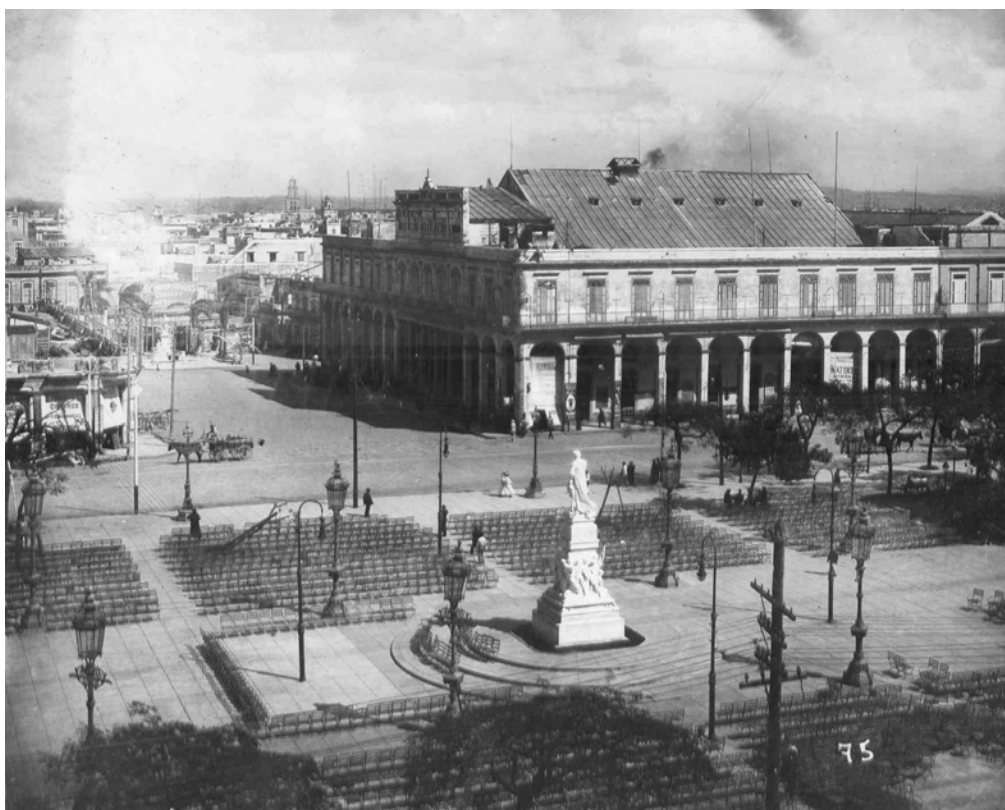
Fig. 2: Vista del Teatro Albisu y el antiguo Centro Asturiano desde el Parque Central de La Habana antes de 1914.

Poco tiempo después, el quince de mayo de 1887 se ultimaron los detalles de la compra del inmueble del Casino Español de La Habana 16 , que también estaba estratégicamente emplazado frente al Parque Central, en la manzana delimitada por las calles de San Rafael, Monserrate, San José y Zulueta, con entrada principal en el n.º. 1 de la primera vía, al lado del Teatro Albisu 17 (Fig. 2).