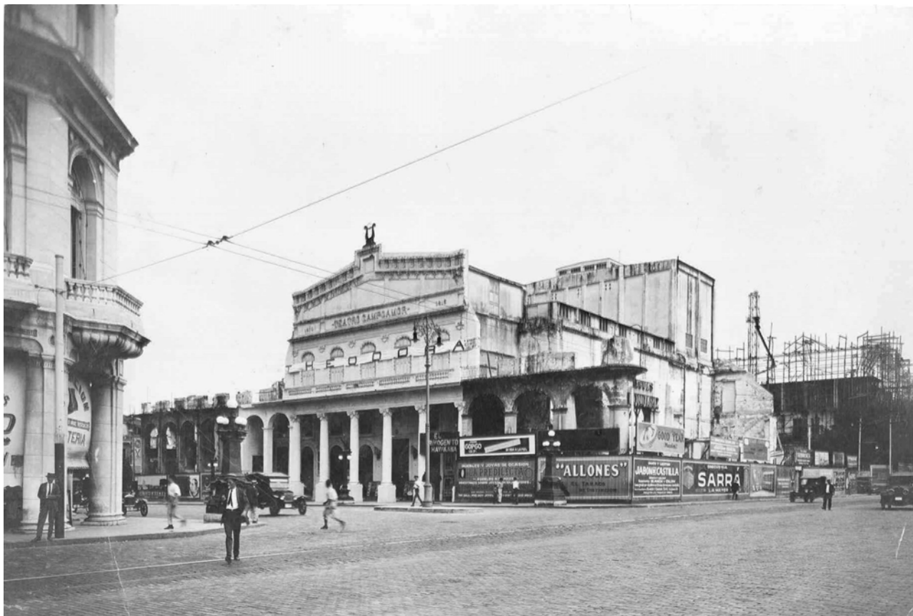
Fig. 5: Estado del Teatro Campoamor y el antiguo Centro Asturiano de La Habana después del incendio de 1918.

El lamentable incendio no mermó el espíritu de los miembros de la sociedad asturiana, que en aquel momento publicaron comunicados cargados de optimismo, donde abogaban por la construcción de una nueva sede. Al respecto, resultan elocuentes los fragmentos que transcribimos: (...) Los socios del Centro Asturiano, henchidos de fogoso patriotismo nacional, férrea voluntad regional, saturados al mismo tiempo de procedimientos e ideas modernas, quieren un palacio digno de glorificar a su tierra extranjera y de embellecer el país en que amorosamente convivimos. / (...) desmentiríamos nuestra estirpe si en esta hora solemne de la historia social no levantáramos un monumento que, hablando a las futuras generaciones, muestre el esfuerzo y la legendaria acometividad de los asturianos en Cuba 29 . La situación que hemos descrito obligó a la directiva de la asociación objeto de nuestro estudio a ocupar, durante casi nueve años, diversos locales en el Casino Español y el Centro Gallego.