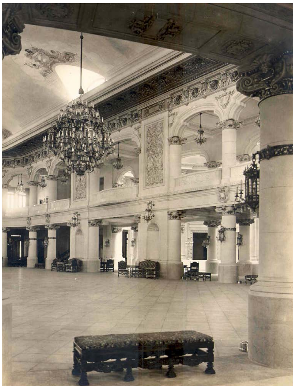
Fig. 9: Salón de fiestas del Palacio del Centro Asturiano de La Habana.

El nueve de septiembre de 1924 se colocó la primera piedra del edificio y en diciembre de ese mismo año se firmó el contrato con la poderosa empresa constructora norteamericana Purdy and Henderson Company, establecida en New York desde 1888 y radicada en Cuba a partir de la firma del Tratado de la Paz en 1899, dando comienzo las obras, tras el derribo del conjunto incendiado 43 .