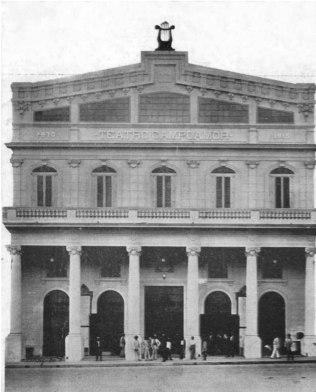
Fig. 4: El Teatro Campoamor de La Habana en 1915, apenas inaugurado.