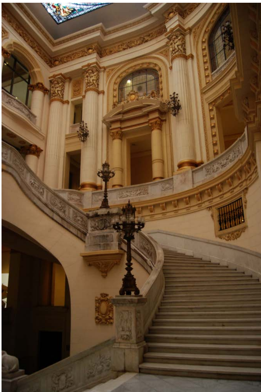
Fig. 8: Detalle de la escalera de honor del edificio dedicado al arte internacional del Museo Nacional de Bellas Artes de La Habana, antiguo Palacio del Centro Asturiano de La Habana.

específico, la última obedecía al tipo imperial con los brazos intermedios de trazado curvo e iluminada cenitalmente por una claraboya, decorada con la representación de las tres carabelas que protagonizaron el primer viaje del almirante Cristóbal Colón a América, salida de los prestigiosos talleres de la sede madrileña de la casa Maumejean Hermanos (Fig. 8).