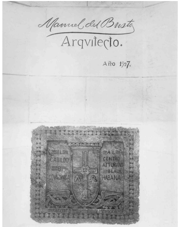
Fig. 6: Rúbrica del arquitecto Manuel del Busto en uno de los muros exteriores del antiguo Palacio del Centro Asturiano de La Habana, 1927. Debajo puede observarse la dedicatoria del Cabildo de Covadonga al Centro Asturiano de La Habana con el escudo del reino de Asturias, agosto de 1923.

parte, la búsqueda en las instituciones cubanas que custodian este tipo de documentación tampoco ha ofrecido resultados satisfactorios 35 .