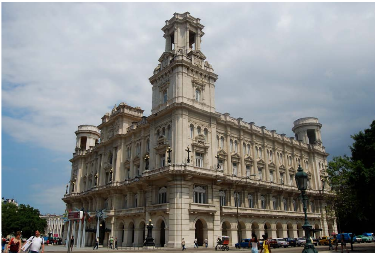
Fig. 10: Estado actual del edificio destinado a las colecciones de arte internacional del Museo Nacional de Bellas Artes de La Habana. antiguo Palacio del Centro Asturiano de La Habana.

cobre y hierro... , pasando por el minucioso trabajo de carpintería, lo cierto es que -durante unos nueve meses- se desplegó tal intensa actividad renovadora, que sus resultados parecen haber sido logrados por un enjambre de artífices 56 .