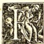
Figura est, quæ aliquo fine aut aliquibus finibus continetur. Circulus est figura plana una linea cōprehensa, intra quem mediæ omnes lineæ inter se pares sint.

Centron est nota circuli medij. Diametros est recta linea per centron immissa, & in utranq; partē fecans circulum. Hemicyclum est circuli dimidiū. Euthygrammæ formæ sunt, quæ rectis lineis continentur. Trigonum, trilaterū. Tetragonū, quod quatuor. Multilaterum, quod pluribus. Triangulum æquilaterum, quod paribus trinis lateribus. Isosceles, quod duo tantum latera paria habet. Scalenon, quod tria latera inæqualia habet. Orthogonum, quod habet omnes rectos angulos quadrilaterum formarū. Quadratum est, quod omnia quatuor latera habet & angulos rectos. Heteromeces quadrangulū nec latera paria habet, nec angulos rectos, similes scutellæ, cuius cōtraria latera & contrarij anguli inter se pares sunt. Sed quadrilaterū omne quod rectis angulis est, trapezia, cætera nominantur parallelæ lineæ, quæ in eadem planitie positæ nunquam inter se contingunt.