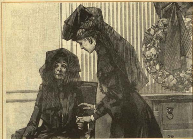
—En cuanto pase la coyuntura nos desludamos. ¿Vale?