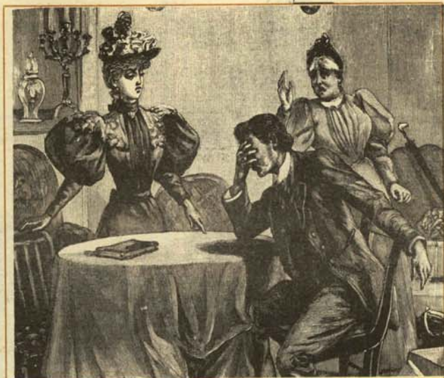
—¡Dics mio! ¡Tendremos que volver a usar el Metro!