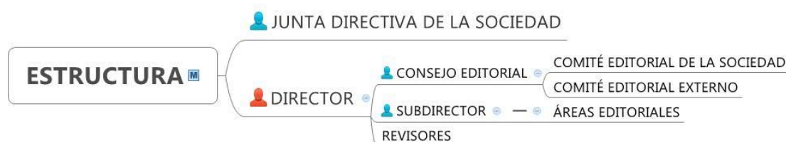
Figura 1. Estructura de la revista